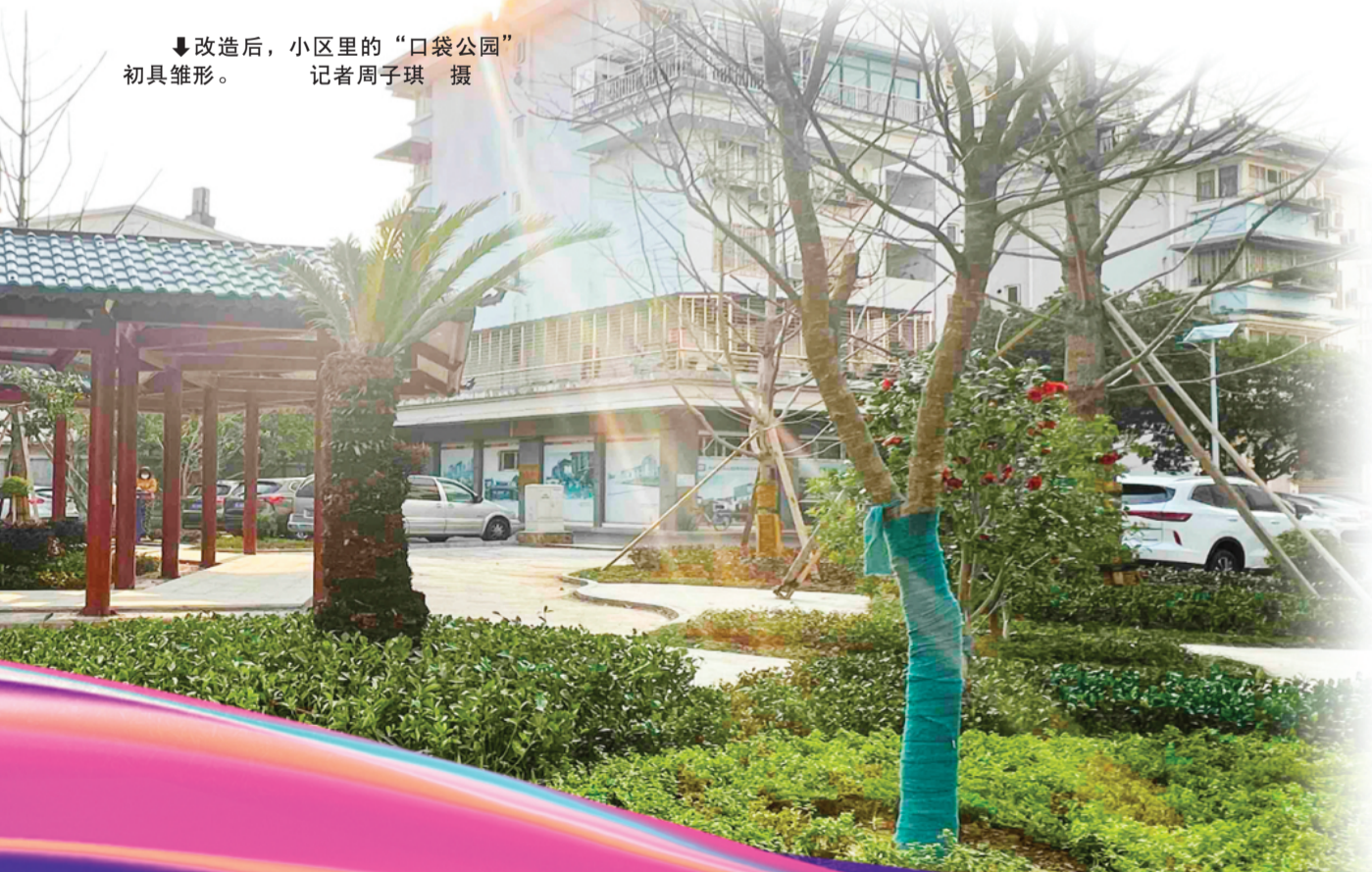
↓改造后，小区里的“口袋公园”初具雏形。