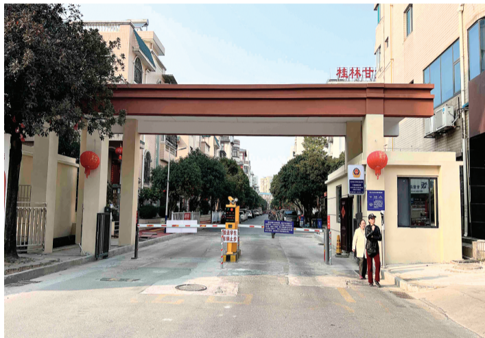
↑改造后的大门设置了道闸。