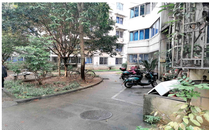
↑小区改造前的一角。