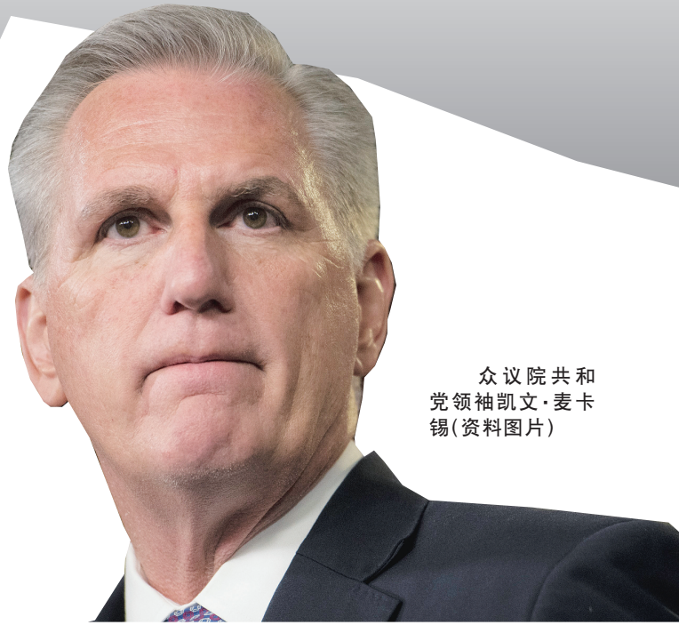
众议院共和党领袖凯文·麦卡锡(资料图片)

分析人士指出，麦卡锡为当选众议院议长可能会寻求对党内保守派妥协，这意味着未来共和党在众议院对民主党的态度将更为强硬。当前，美国国会参众两院分别由民主、共和两党控制，双方均已开始瞄准2024年美国总统选举。因此，未来美国的党争问题预计会进一步加剧。