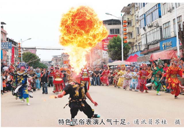
特色民俗表演人气十足。

本报讯(记者陈娟 通讯员苏桂)6月27日,平乐县二塘镇举办2026年民俗文化果蔬节。活动以文艺汇演、民俗巡游、非遗展演为载体,集中展销本地名、特、优农产品,吸引周边市县群众及区内外客商齐聚现场,观摩特色民俗、开展交流洽谈、对接农产品产销合作。