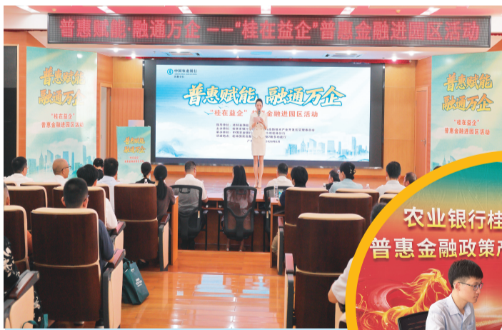
▲“桂在益企”普惠金融服务进园区活动现场。

活动现场,桂林金融监管分局相关负责人就深化政银担企联动、建立普惠金融长效服务机制作出工作部署,明确要求各金融机构持续优化小微融资环境,加码对园区中小微企业的信贷扶持。高新区管委会相关负责