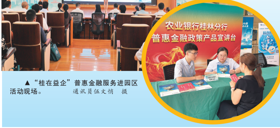
农业银行桂林分行普惠金融政策宣讲台

下一步,农行桂林分行将以本次活动为新起点,持续倾斜普惠信贷投放资源,深耕园区产业金融场景,细化面向小微企业的全流程服务举措,稳步增强金融服务实体经济的实效,为桂林高新区产业高质量发展提供坚实金融支撑。