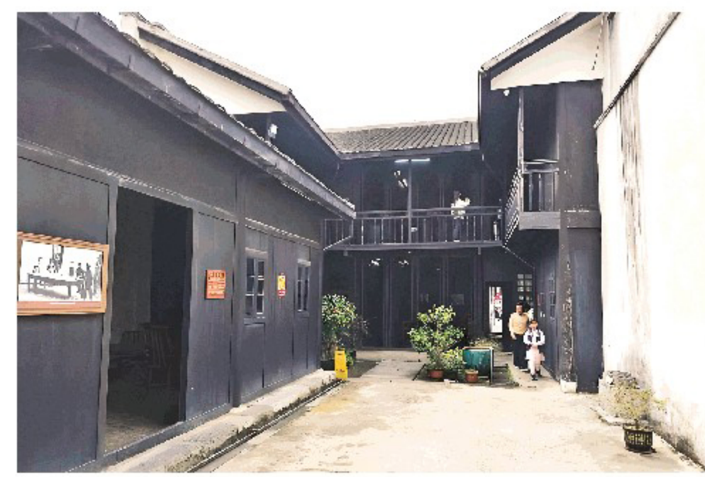
▲八路军桂林办事处旧址。

在党中央的统筹部署下，1938年11月，八路军桂林办事处正式建立，为坚持斗争阵地、掩护革命工作，中共党组织以“万祥齋”为公开掩护，于繁华闹市中潜伏扎根。一楼是对