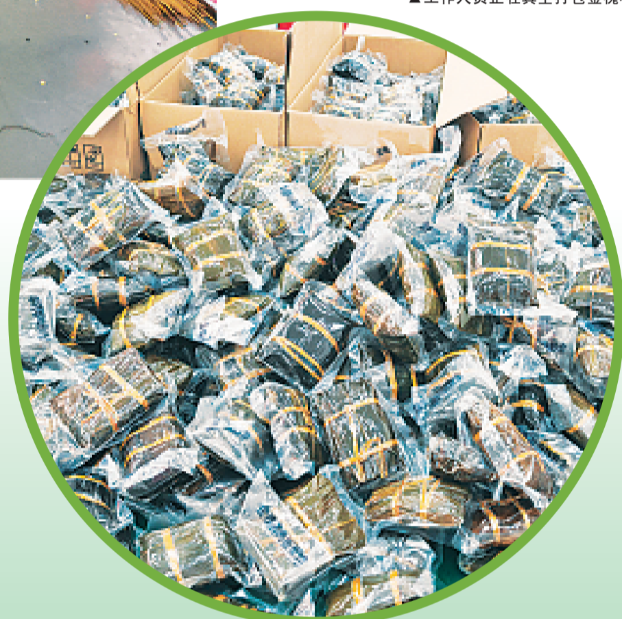
▲打包好的全州金槐粽，准备发往外地市场。

笔墨承道，习字立人。艺之缘书法工作室创办二十五载，始终秉持“严师执教、质量为先”的初心，深耕硬笔书法教育，已培育千余名学子，在全国权威硬笔书法大赛中屡获佳绩。