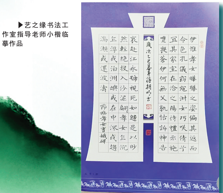
▲艺之缘书法工作室指导老师小楷临摹作品