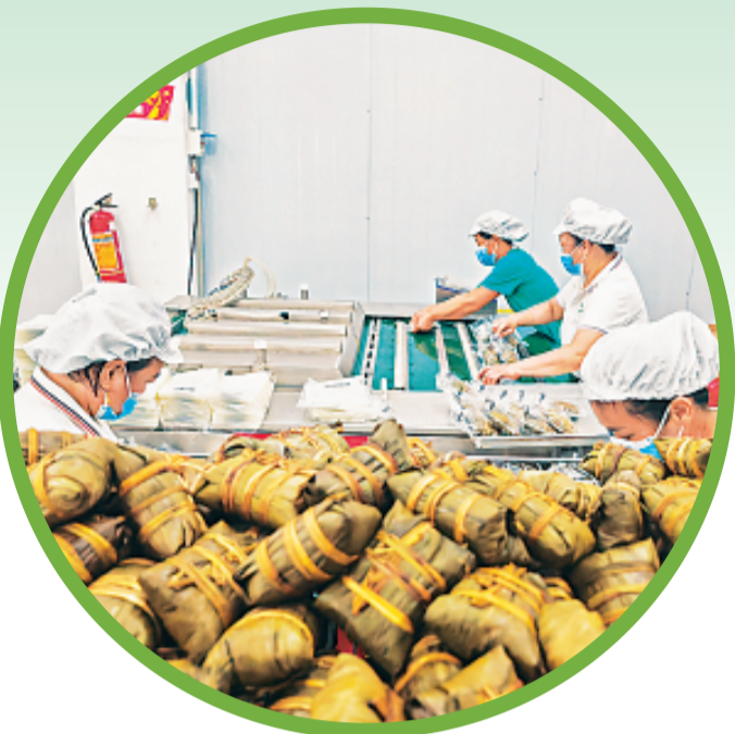
▲工作人员正在真空打包金槐粽。