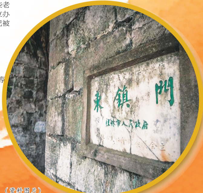
▶东镇门被列为文物保护单位标识。(资料图片)