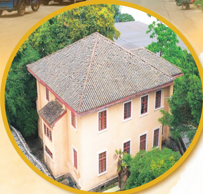
▲位于东镇路上的李济深旧居。

东镇门这750多年来守护的，不单是城防的森严，更是桂林人通往自然、通往日常生活的那份安定。