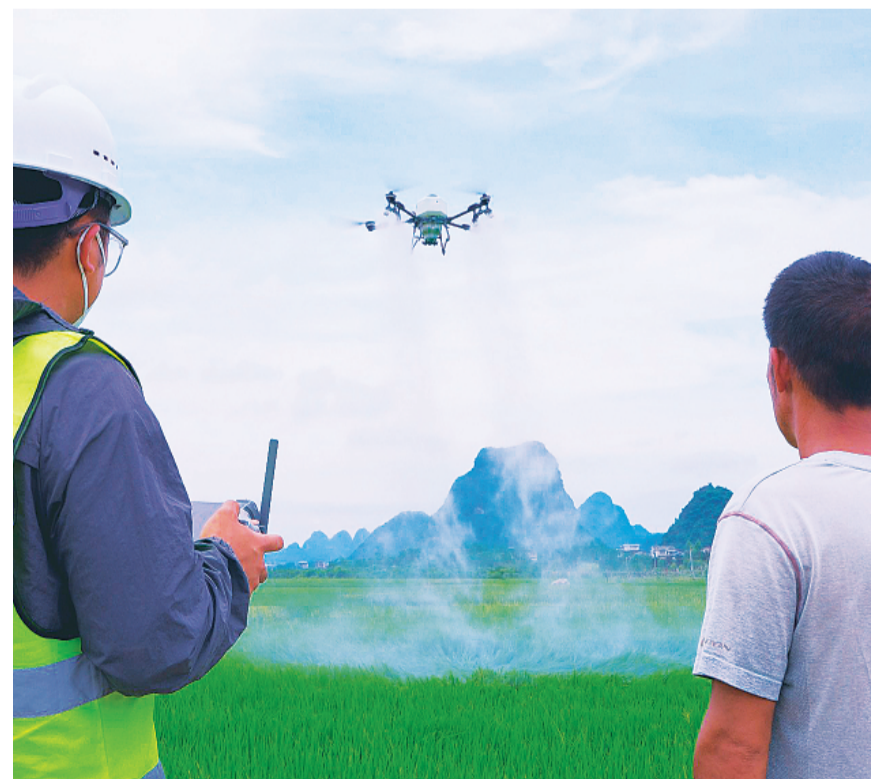
▲无人机对连片种植的水稻进行喷施作业。

喷施作业期间，临桂区农业农村局组织农技人员深入田间地头蹲点巡查，实时把控药液配比、飞行参数、喷施时段，紧盯作业全流程，筑牢田间管护质量防线。据了解，今年临桂区统筹47