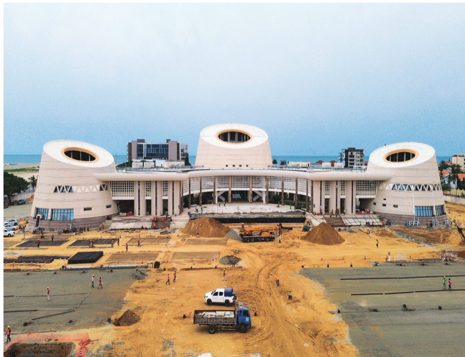
▲这是2月10日拍摄的贝宁科托努会议中心广场改造项目施工现场(无人机照片)。

“提升基础设施质量，改善综合服务水平，是保障国家级重大活动举办的迫切需要。”贝宁相关部门在改造之初即对项目提出要求。为了迎接新一届总统的就职典礼，广场的综合改造被提上日程，建设工期仅有不到3个月，需涵盖广场铺装、钢筋混凝土