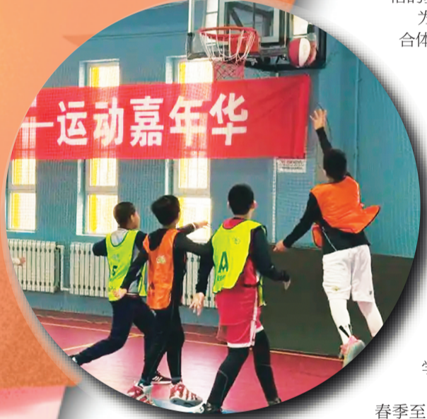
▲辽宁省沈阳市南京一校校长白岛第一小学学生在运动中。