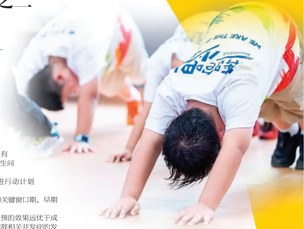
▲2025年7月9日，浙江省湖州市第十二中学训练室，青少年在减肥训练营里进行活力有氧健身操训练。