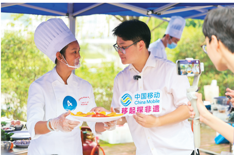
中国移动青年志愿者以探寻非遗形式进行宣传。

在近期举办的2026年“平乐十八酿”制作技能竞赛上,桂林移动提前一周组建专项保障团队,深入比赛地酒店及周边区域开展网络勘测与优化,精准