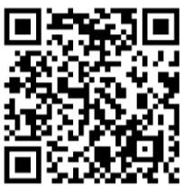
▲扫码获取中央生态环境保护督察组群众信访举报转办和边督边改公开情况一览表（第六批）