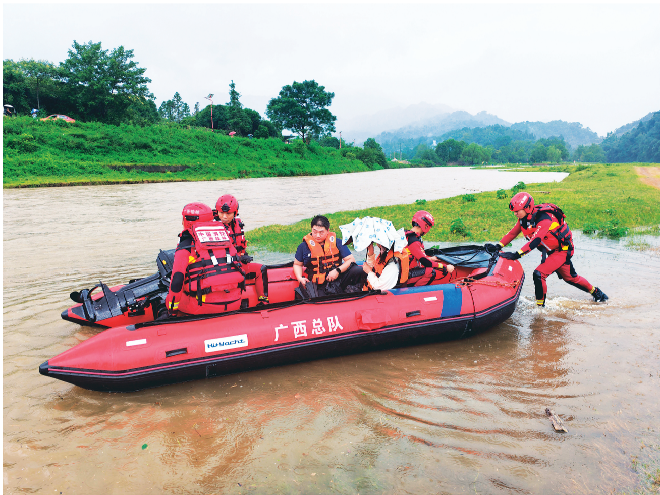
▲队员们在开展水域救援训练。