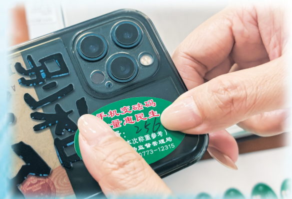
▲我市市场监管部门开展“手机变砝码”便民活动。工作人员为市民的手机称重后，贴上写有克重的专用贴，就可以成为检验市场上电子秤准确与否的“砝码”。

加码市场整治力度。我市整合综合整治、突击巡查、专项排查与日常常态化监管力量，依法打击“鬼秤”、缺斤短两等侵害消费者合法权益的计量违法行为。