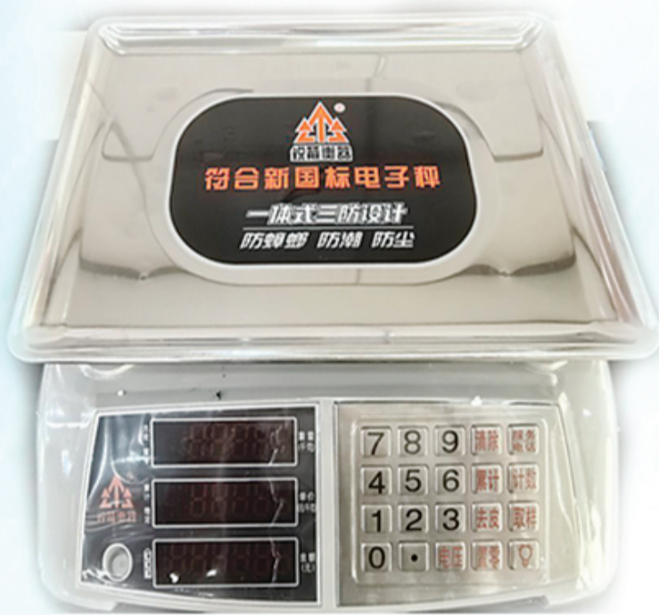
▲新国标电子计价秤。

新规落地将带来哪些变化？我市监管部门如何护航计量公平？在“世界计量日”到来之际，记者带您聚焦电子计价秤监管与服务，解码方寸秤背后的诚信底色与民生温度。