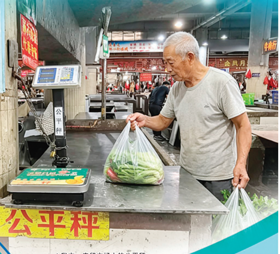
▲我市一农贸市场内的公平秤。