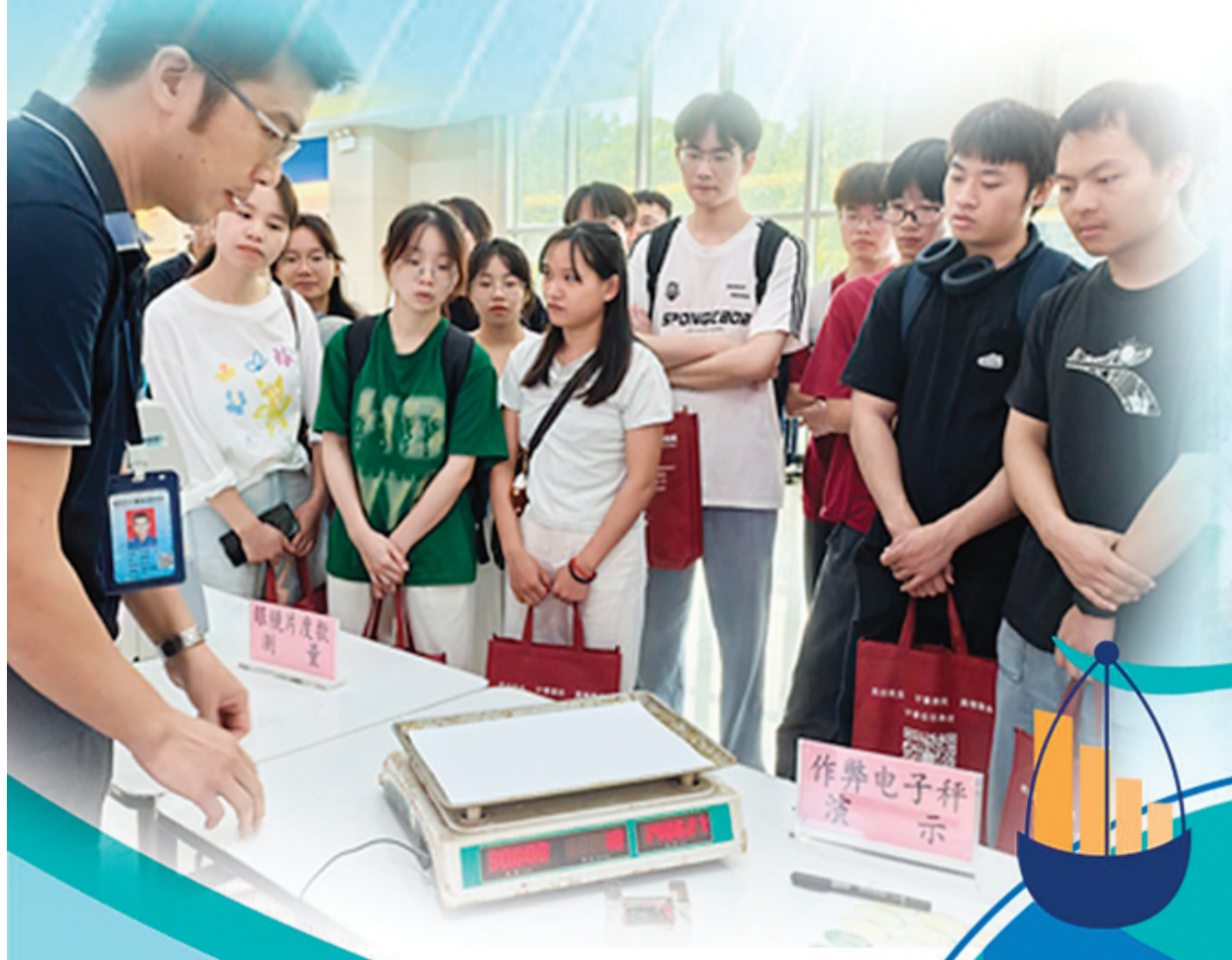
▲在桂林市计量测试研究所，工作人员为市民演示“鬼秤”的作弊方法，提高市民的防范意识。