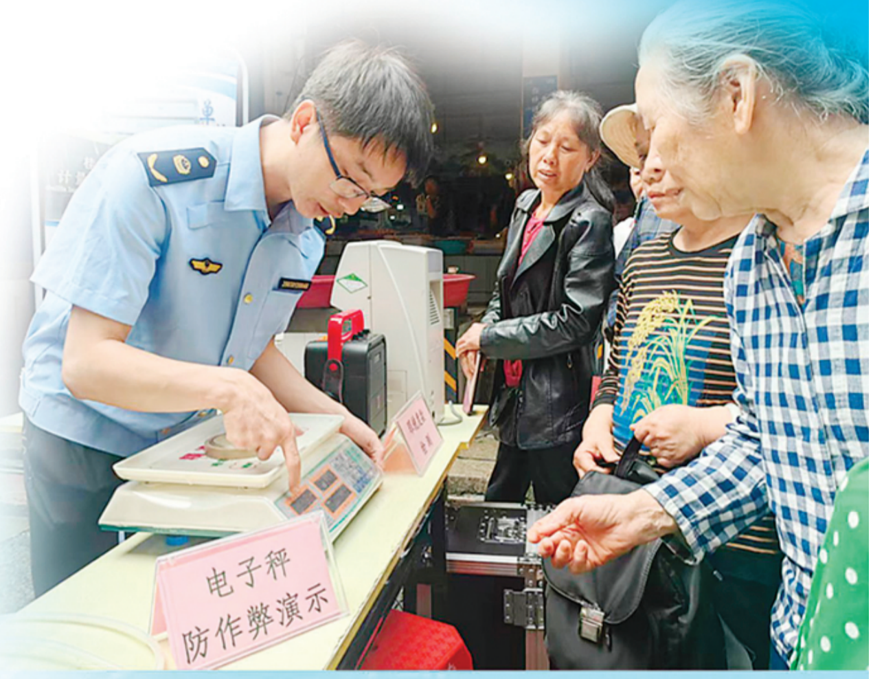
▲桂林市市场监管局工作人员深入农贸市场，开展电子秤有关知识宣传活动。

为从根本上阻断问题秤流通链条，我市不断筑牢源头监管防线。相关部门开辟电子计价秤强制检定绿色通道，常态化推进全市在用电子计价秤全面强检工作；同时紧盯流通销售环节，对排查发现的不合格电子秤深挖溯源，严厉查处售卖违规电子计价秤的经营主体，从产销两端压缩违规器具生存空间。此外，我市依托多元监管模式，持续