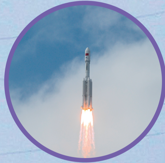
↓5月11日8时14分，搭载天舟十号货运飞船的长征七号遥十一运载火箭，在我国文昌航天发射场点火发射。