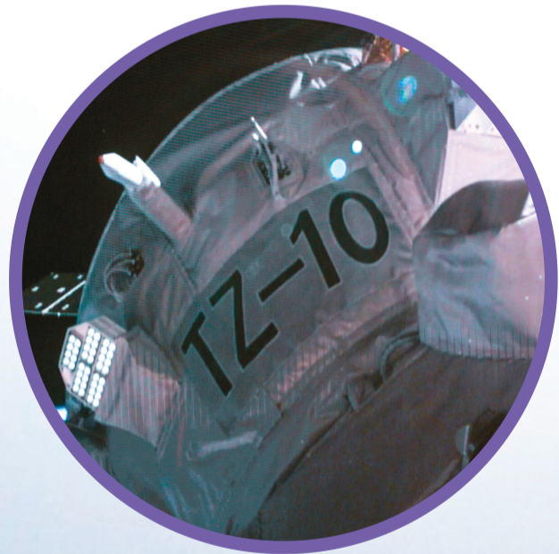
↑5月11日在北京航天飞行控制中心屏幕上拍摄的天舟十号货运飞船和空间站组合体完成交会对接的画面。