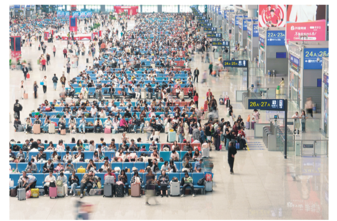
▲5月5日，旅客在贵阳北站候车室候车。

新华社北京5月6日电（记者叶昊鸣 王隼）记者6日从交通运输部获悉，2026年“五一”假期（5月1日至5日），全社会跨区域人员流动总量为151712.8万人次，日均为30342.56万人次，同比增长3.49%。 具体来看，公路人员流动总量为139172万人次，日均为27834.4万人次，同比增长3.51%。其中，高速公路及普通国道非营业性小客车人员出行总量为119287万人次，日均为23857.4万人次，同比增长2.57%；公路营业性客运总量为19885万人次，日均为3977万人次，同比增长9.53%。 铁路客运总量为10637.7万人次，日均为2127.54万人次，同比增长4.6%。水路客运总量为849.2万人次，日均为169.84万人次，同比下降1.37%。民航客运总量为1054万人次，日均为210.8万人次，同比下降5.74%。