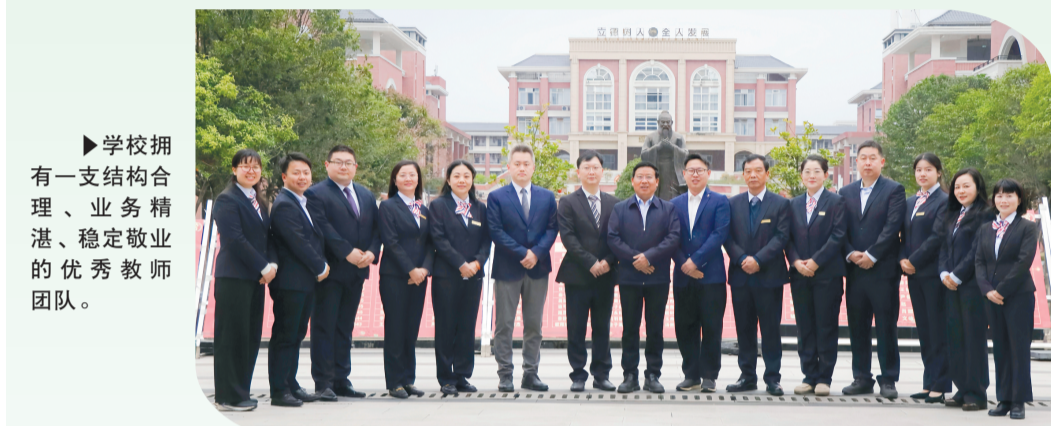
学校拥有一支结构合理、业务精湛、稳定敬业的优秀教师团队。