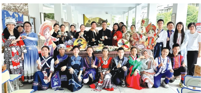
师生们在“百家宴”活动中合影留念

在接下来的班级美食分享会上，师生们围坐在一起，品美食、聊民俗、话友情，进一步了解了中华传统美食承载的文化寓意与民族情感。现场一片欢声笑语，其乐融融。大家纷纷表示，“我们不仅品尝到了舌尖上的美味，更感受到了中华文化的博大精深。各族同学都是