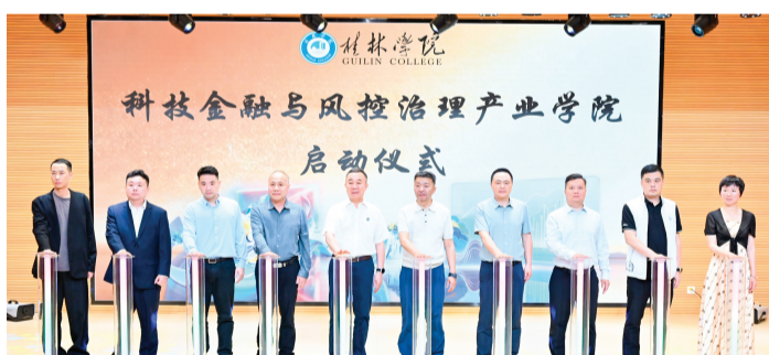
校协企代表共同启动产业学院建设。

据介绍，桂林学院科技金融与风控治理产业学院坚持“高校主导、企业核心、双向赋能、协同发展”模式，聚焦人才共育、资源共