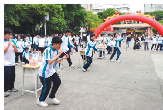
在学校科技馆前，空运乒乓球比赛正在进行中

下午，科技竞赛环节在校园各个地点同步拉开帷幕，14个覆盖物理、化学、生物、信息技术、美术、工程等多个领域的竞赛项目同步开赛，整个校园变身成为充满奇思妙想的“创新工场”。在科技馆，纸青蛙跳远竞赛热火朝天，同学们反复调整纸张结构，一只“弹跳王”竟跳出了2.3米的成绩；物理实验室里，选手们用橡皮筋、纸盒、吸管等日常材料，亲手制作出“古筝”、排箫等简易乐器；通用技术教室里，“气球让火柴旋转”实验让同学们直观感受静电吸附的奥秘……赛场上，桂林一中的学子们尽情施展才华，将书本上的知识运用到实际操作中，体