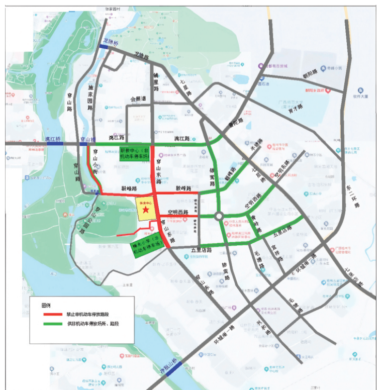
临时管控区域示意图