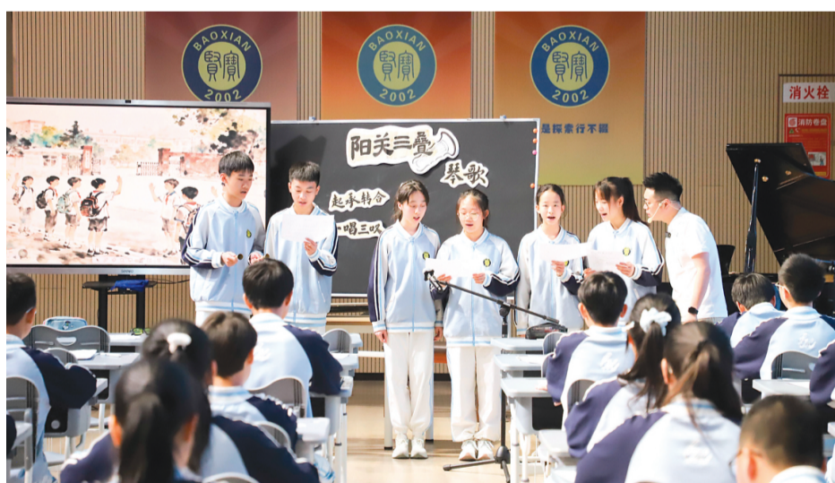
▲教研活动中，全区各地音乐教师轮番登台，为学生们带来趣味音乐课堂。

活动中，由我市多所中小学带来的非遗与艺术工作坊展示吸引了参会老师们的眼球：市宝贤学校的创新音乐坊展示、广西师