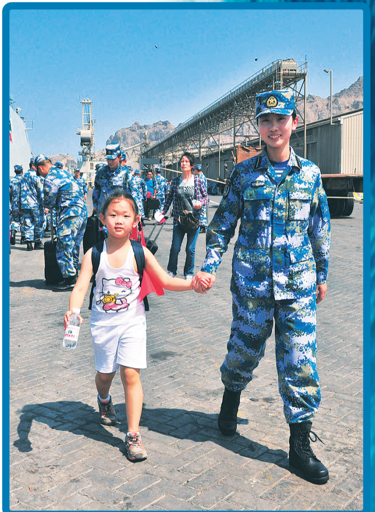
▲2015年3月29日，中国海军第十九批护航编队临沂舰抵达也门亚丁港，临沂舰舰员帮助撤离的儿童登舰。