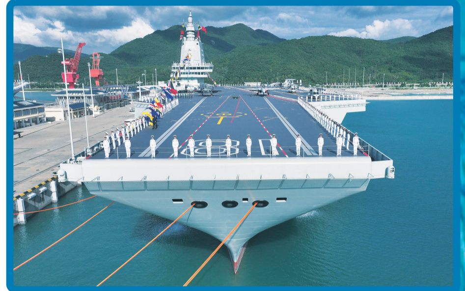
▲2025年11月5日，我国第一艘电磁弹射型航空母舰福建舰入列授旗仪式在海南三亚某军港举行。