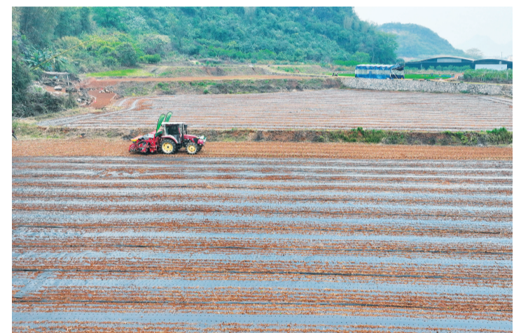
▲早稻机械化作业现场。

本报讯（记者刘菁 通讯员杨丽）春回大地，农时催人。眼下正值春耕春播关键时节，在平乐县张家镇湖洋村的田间地头，早稻种植工作正抢抓农时全面展开。