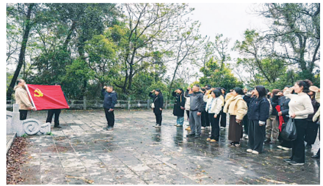
▲祭英烈现场。

本报讯(记者周文琼 通讯员王亚东)清明节将至,七星区汇通社区党委、羊角山社区党委、猫儿山社区党委、辰山社区党委的党员们,和社区各行业的群众一起来到尧山苏墓、罗文坤、张海萍革命烈士纪念碑,共同开展“缅怀革命先烈 弘扬爱国精神”主题党日活