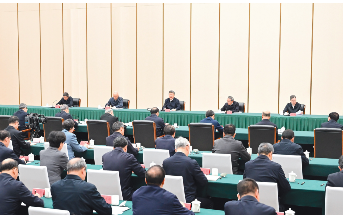
▲3月23日,中共中央总书记、国家主席、中央军委主席习近平在河北雄安新区考察,并主持召开深入推进雄安新区高质量建设和发展座谈会。这是23日下午,习近平主持召开深入推进雄安新区高质量建设和发展座谈会并发表重要讲话。