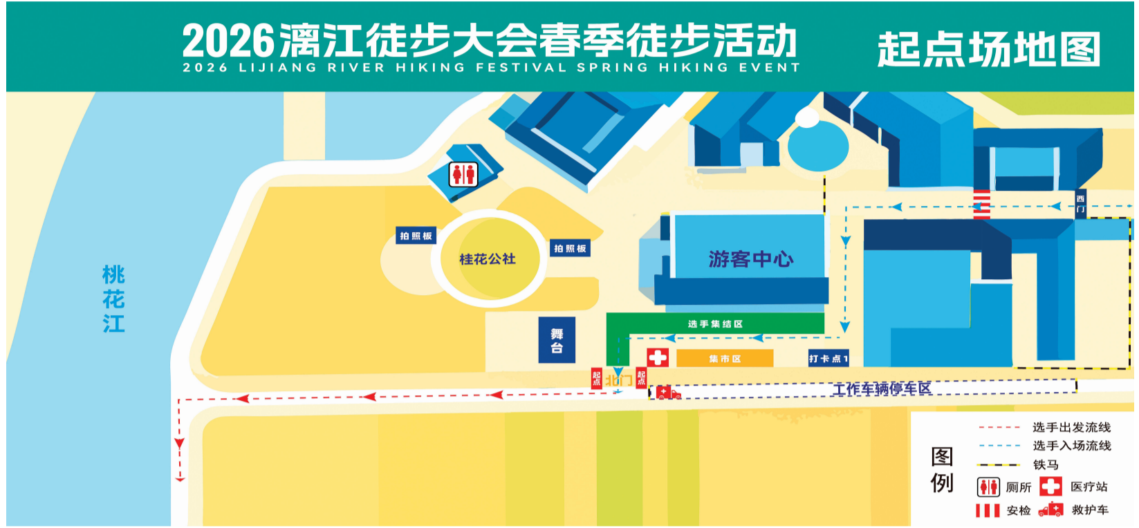
▲起点示意图。

对于桂林而言，这条路线承载的远不止一场万人徒步活动，它是文体旅商农融合发展的生动实践，更是一次将活动流量转化为消费留量的创新探索。当徒步者从“看风景的人”真正变成“风景里的人”，秀甲天下的桂林山水也不再只是眼睛里的画面，而是心中探寻的“诗与远方”的真正目的地。