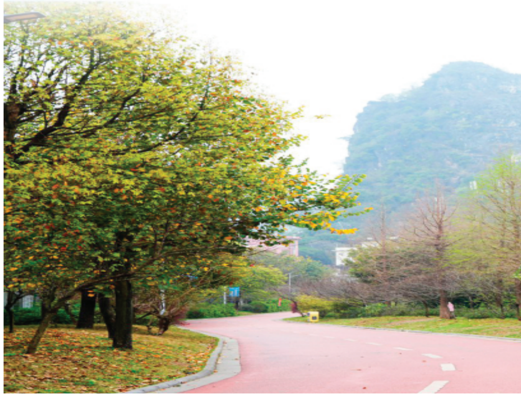
▲漓江步道一片“桃红柳绿”