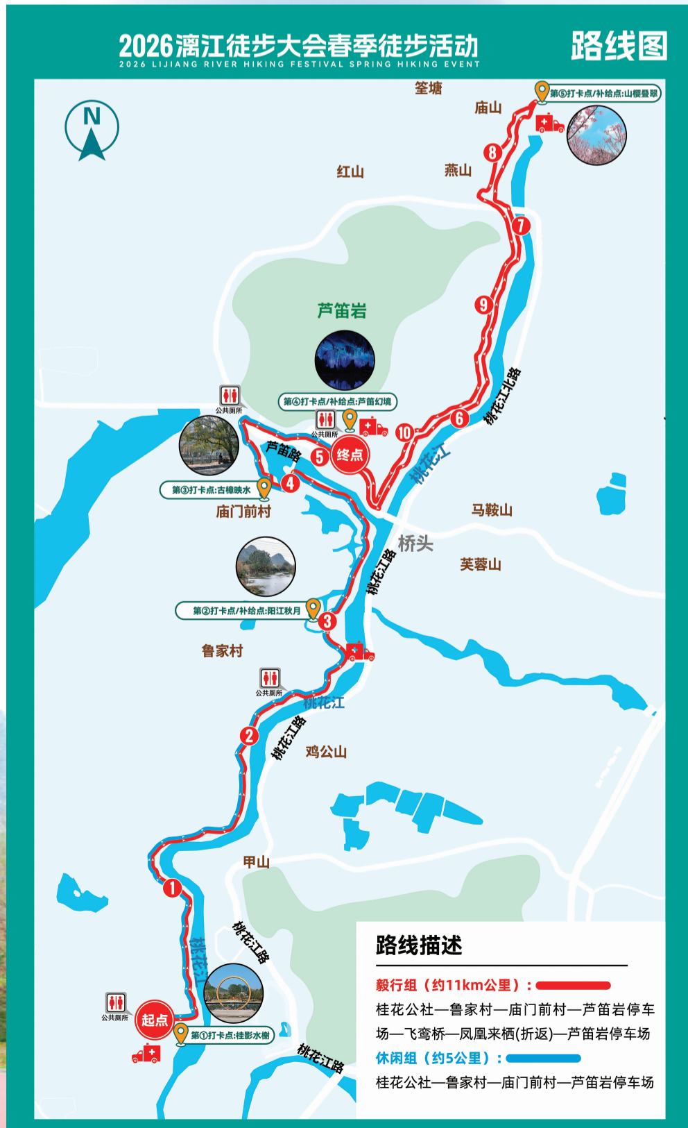
▲活动路线图。