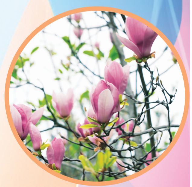
▲桃花江畔百花开正艳。