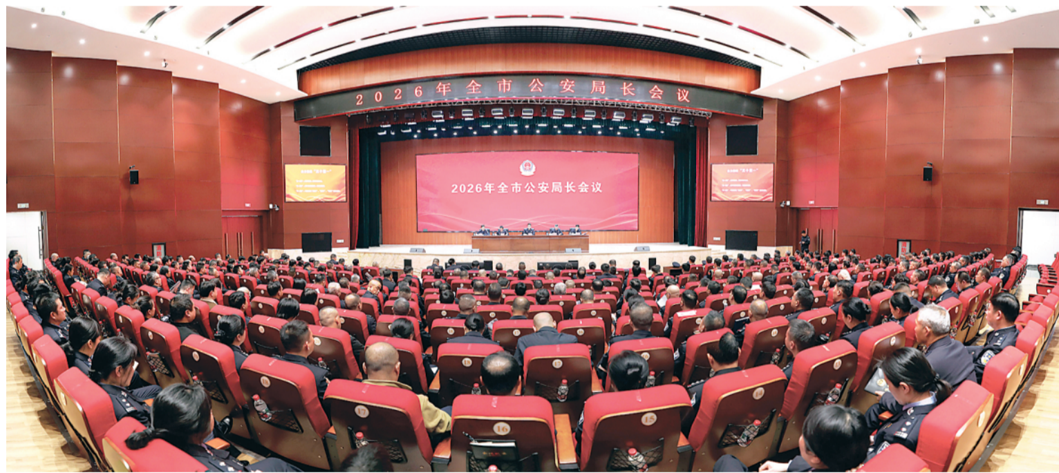
▲2026年全市公安局长会议现场。

回眸2025,桂林公安交出了一份厚重提气的答卷:七项核心打击指标领跑全区,26项工作获自治区级以上领导肯定,25项经验做法在全区推广,“情指行”一体化侦查中心建设经验走向全国……这些成绩,为新征程积蓄了底气和力量。展望2026,全市公安机关将锚定使命、实干争先,以高水平安全保障高质量发展,以智能化转型提升治理效能,以过硬队伍护航使命落实。