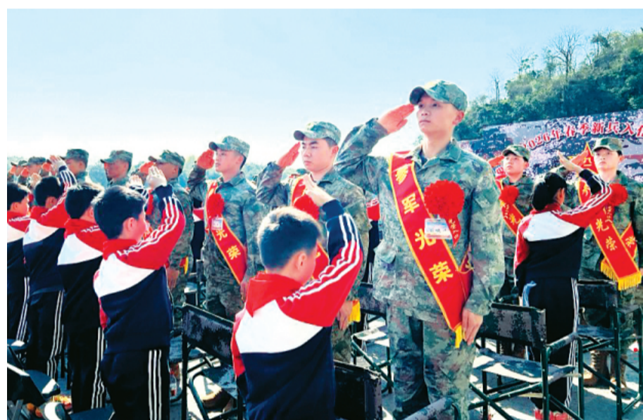
▲欢送大会现场,小学生代表为新兵们细心整理绒花,新兵们敬礼致谢。