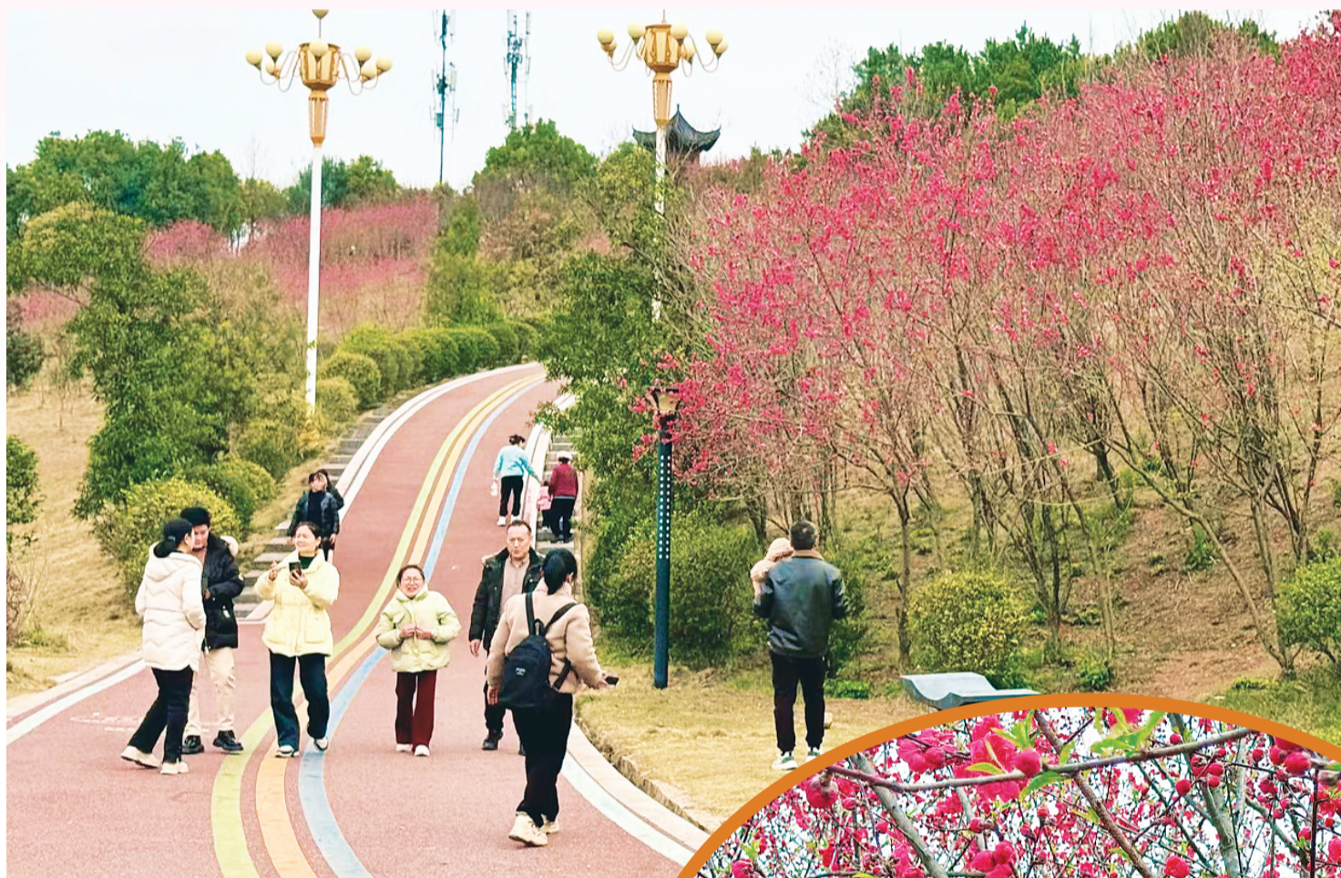
▲桃花盛放，春意满山林，吸引许多市民前来散步。