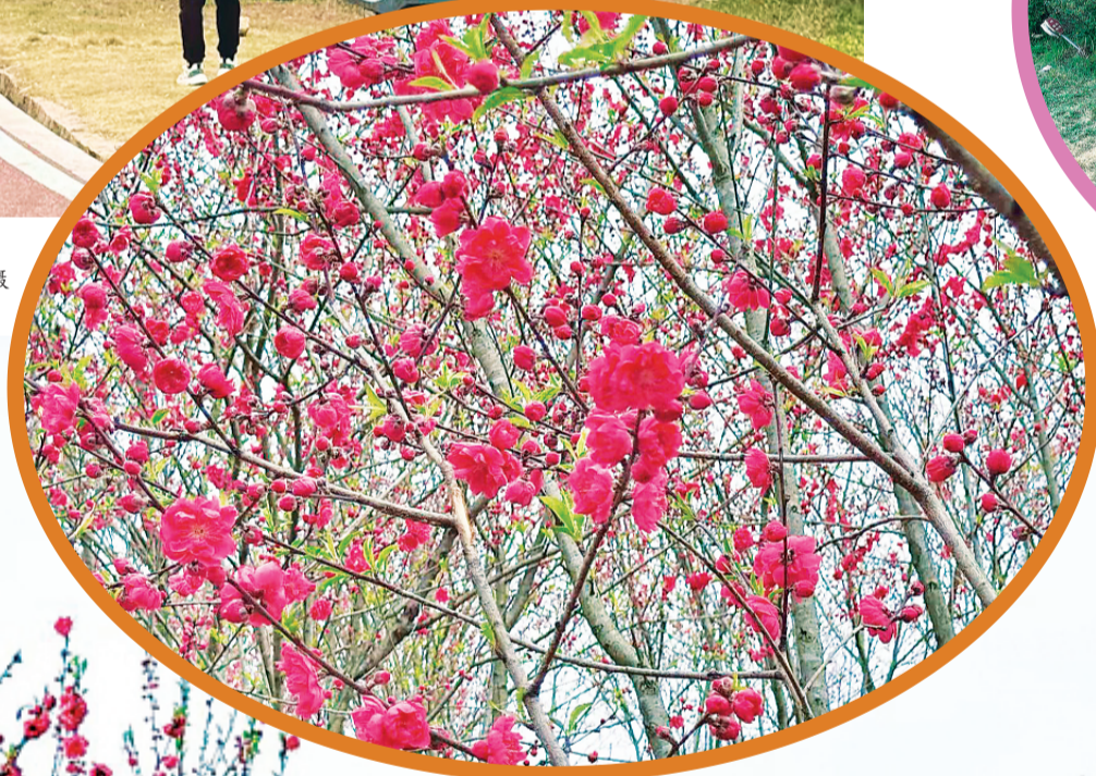
▼镇湘塔下，桃花漫坡，小径通幽。