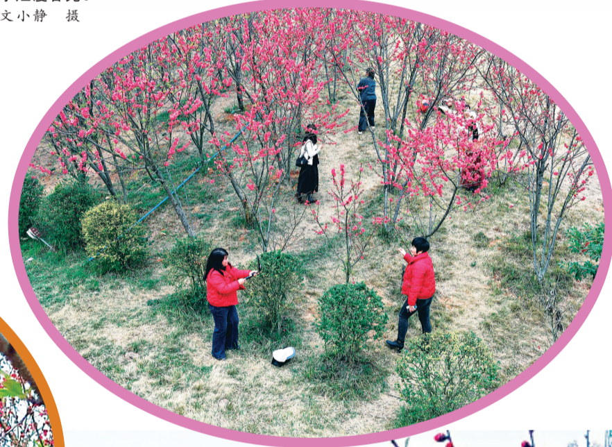
▲春风十里桃花开，市民穿梭花间打卡留影，定格烂漫春光。