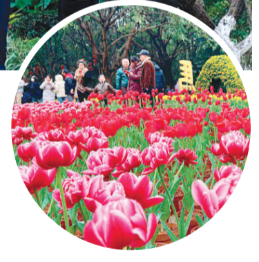
▲人们徜徉在花海之中。

记者了解到，当天，象山、七星、叠彩、虞山等各大公园景区同样游人如织，各类赏花、游园、民俗体验活动有序开展。市民游客走出家门、亲近自然，在欢声笑语中开启马年新春。我市各大公园景区正以优美的环境、丰富的活动与贴心的服务，喜迎八方来客。