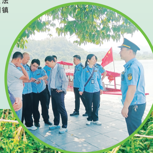
▶2025年6月，全州县市场监管局、交通局、水利局、应急管理局联合全州镇，检查水上游览项目安全工作。