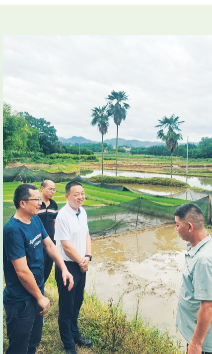
▲2025年6月，全州镇政府主要领导在邓家埠、柘桥村委查看测产网点、管控类土地的种植情况。

使命在肩，初心如磐。展望2026，全州镇将继续聚焦经济发展，力争引进一批投资规模大、科技含量高、带动能力强的工业项目；全力推进光绪岭风电项目全州镇段、全州国家气象站新址建设等工作；加快农业现代化建设，创新社会治理，奋力在富民强镇的新征程上展现更大作为、交出更优答卷。