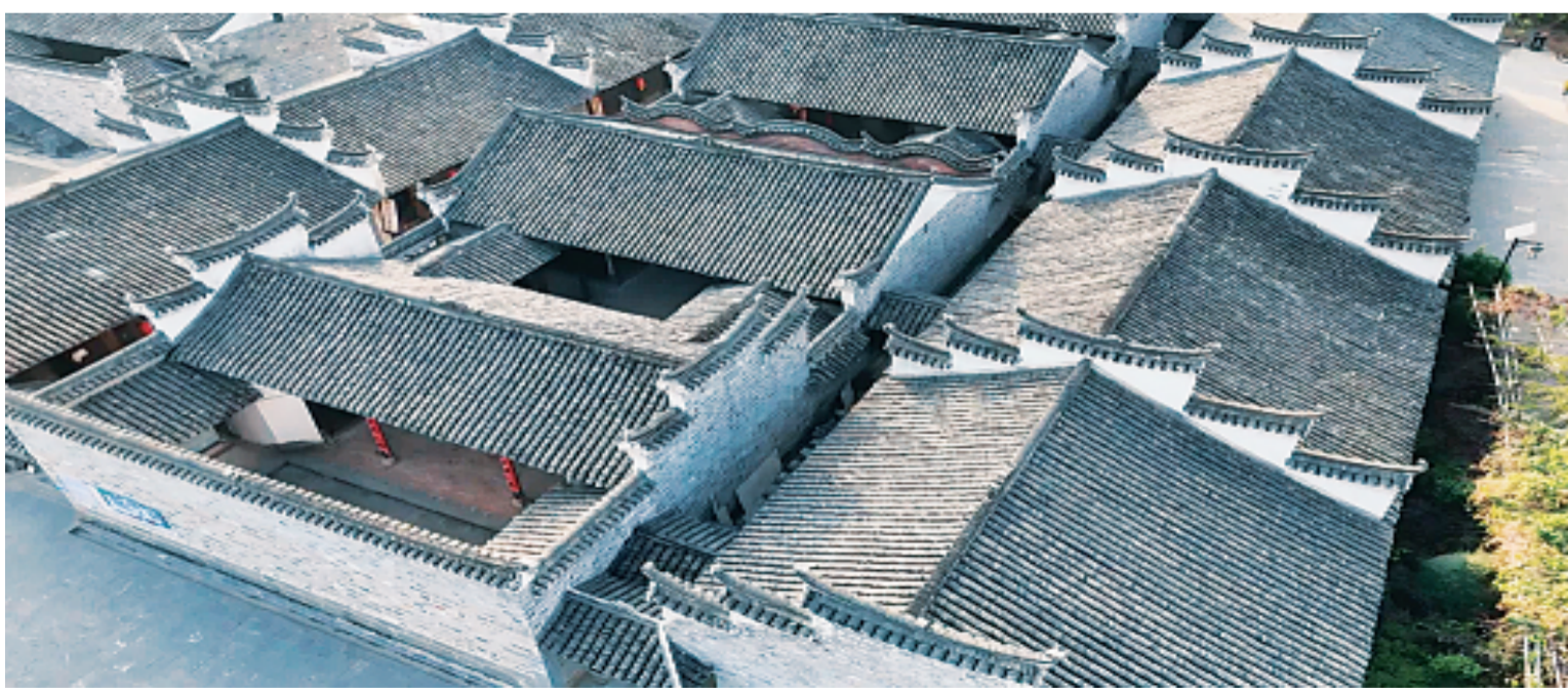
这是唐以金异地复建的三进四院、硬山顶穿斗式结构的清代建筑。

为了搜集古建筑砖雕展品，每月到桂林治病，他总要绕道古玩市场淘宝。一套心仪的十二生肖砖雕开价2000元，他反复掂量，最终在志愿者协助下以800元成交。捧着砖雕回到馆里，他当即擦拭陈列：“‘三雕’齐了，文化才完整。”