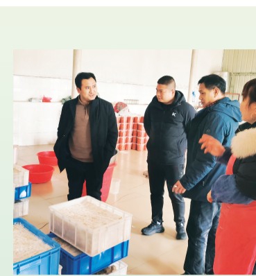
▲2025年2月，全州镇党委主要领导在柘桥村委调研农产品加工制作及小微民营企业发展情况。