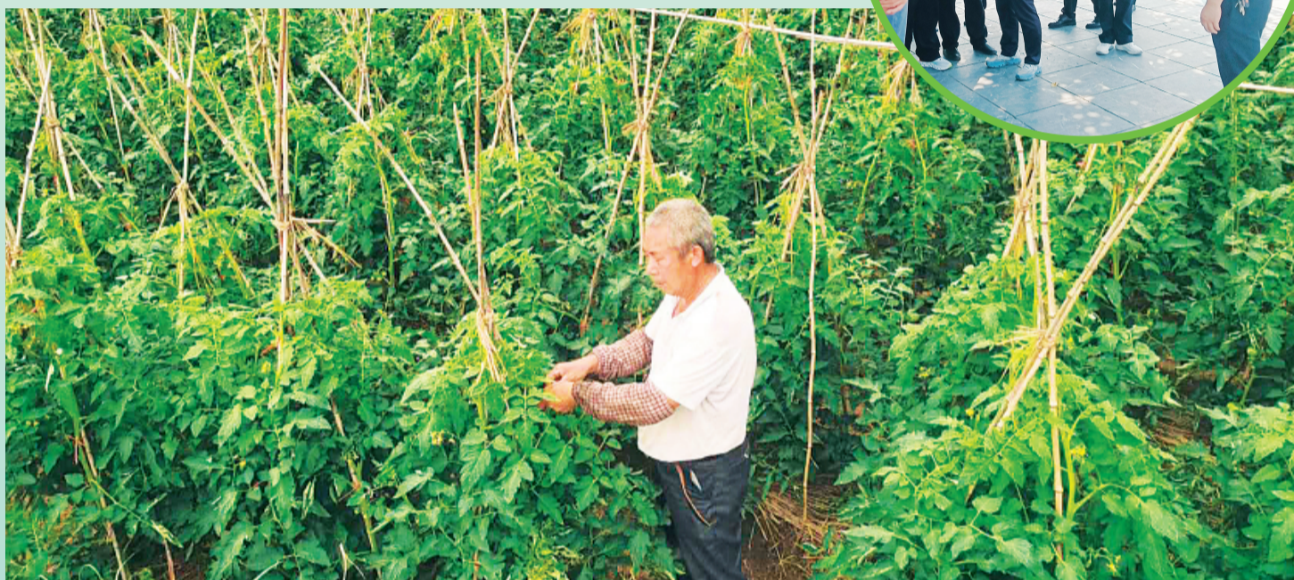
▲全州镇土地肥沃，脱贫农户因地制宜，积极发展西红柿等种植产业。