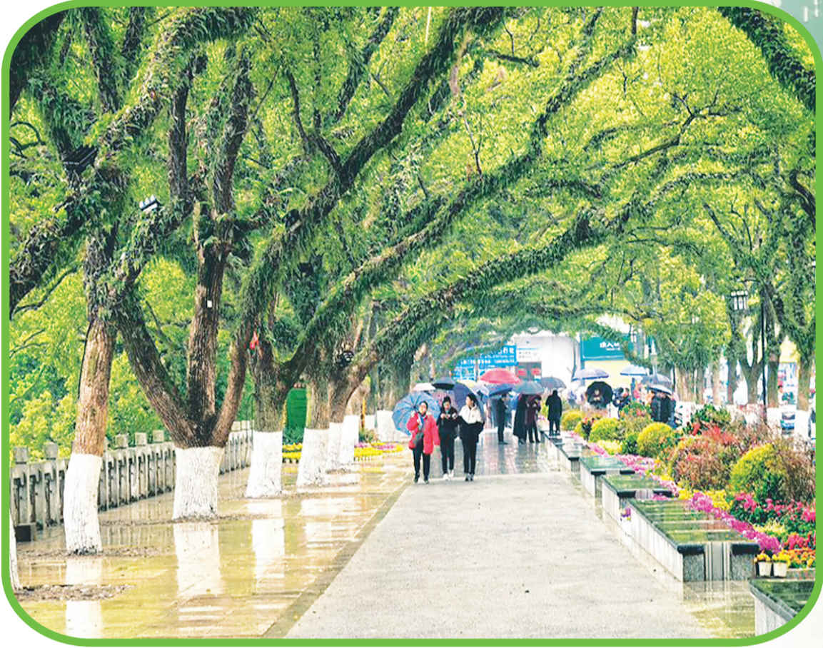
▲如今的滨江路，人行道整洁通畅，视线通透，花团锦簇。铺设的透水路面为樟树打通地下“呼吸通道”。