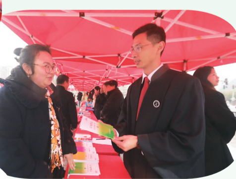
▲图为“法治大转盘”的趣味形式让群众玩中学到法律知识。