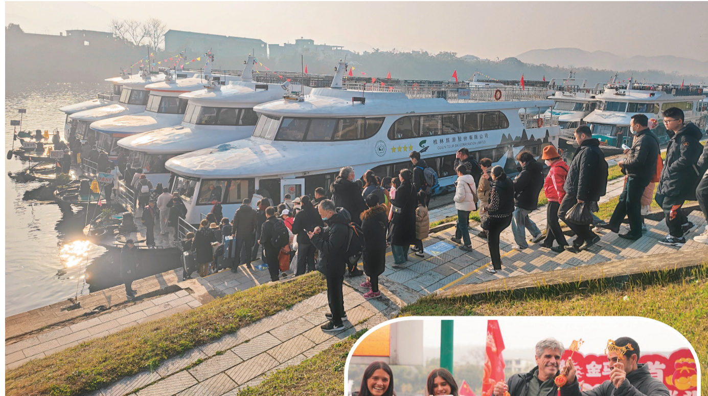
▲连日来，乘坐游船游览漓江的游客络绎不绝。