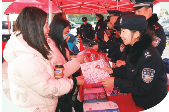
▼图为现场律师耐心解答群众关心的婚姻家庭、劳动权益、物业纠纷等法律问题。