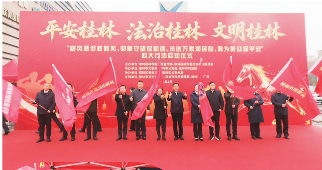
▲图为与会领导为8名来自基层的矛盾纠纷调解人才库代表授旗。