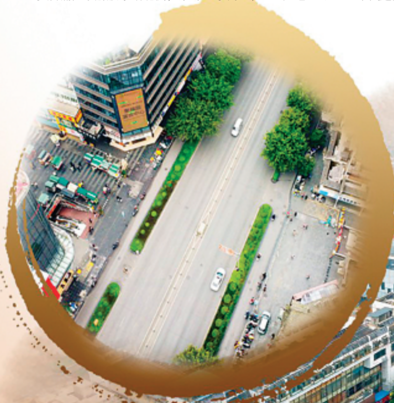
◀ 解放东路与正阳路相交的十字路口。记者苏展 摄