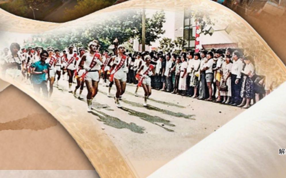
◀ 1990年亚运会圣火在解放东路上传递。