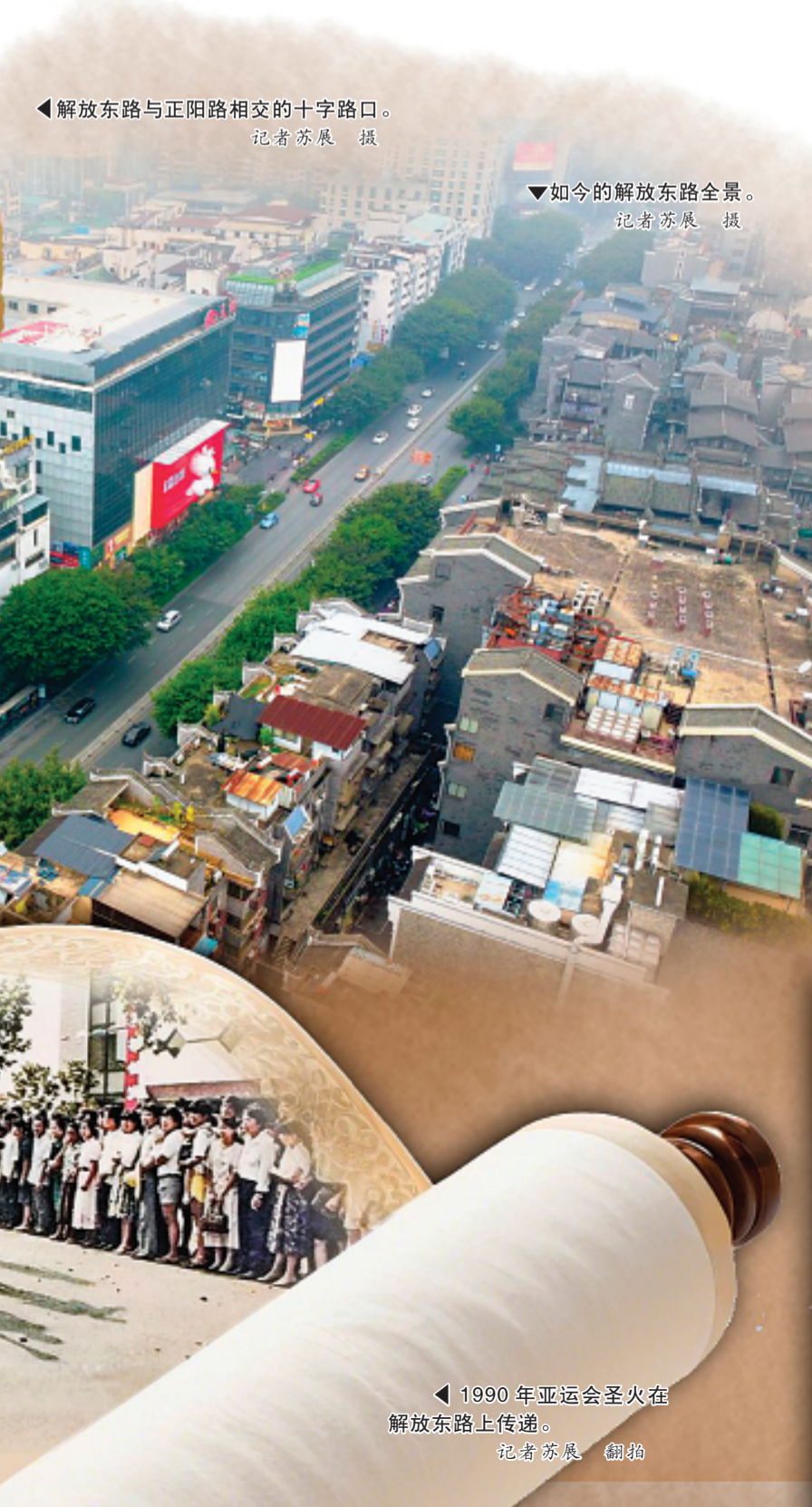
▼ 如今的解放东路全景。