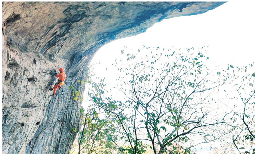
▲搜救队绳索专业队员系好安全绳悬空作业。

全绳悬空作业,脚下是陡峭崖壁,身旁是凛冽寒风,先细致勘测崖壁结构,再精准开展钻孔、打钉、安装挂片等工作,并反复核查每一个锚点的稳固性,确保训练线路安全可靠。截至目前,核心区打钉任务全部完成,多条攀岩训练线路顺利开辟。后续,搜救队绳索专业队员将持续拓展线路,开发适配各类救援场景的训练科目,进一步提升基地实战化训练水平。