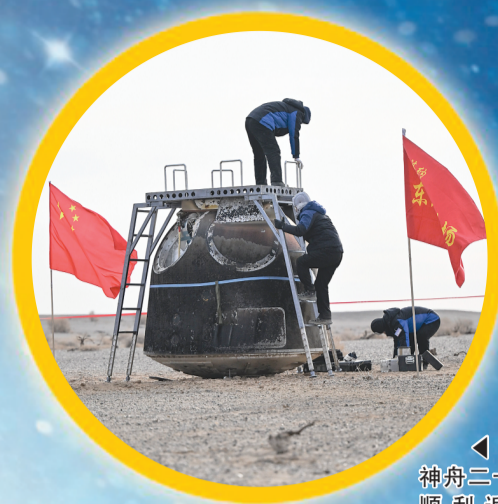
◀1月19日，神舟二十号飞船安全顺利返回东风着陆场。