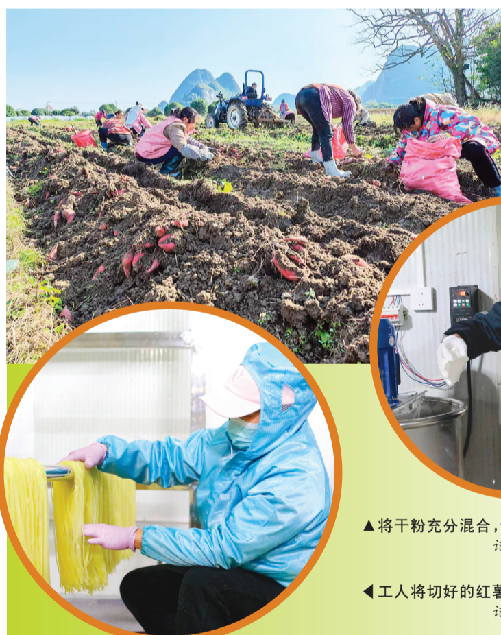
▲工人们在红薯地里忙碌着。崔丽娟 摄