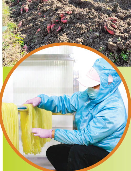
▲将干粉充分混合，制作红薯粉。