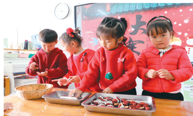
▲孩子们动手制作糕点。

本报讯（记者刘菁/文）大寒启年，暖意渐生。1月19日，临桂区两江镇渡头幼儿园开展了一场以“大寒时节，感恩大地”为主题的趣味活动。孩子们在老师的带领下剪窗花、写福字、做糕点，一边体验民俗，感知节气魅力，同时也在实践中传递感恩温情。