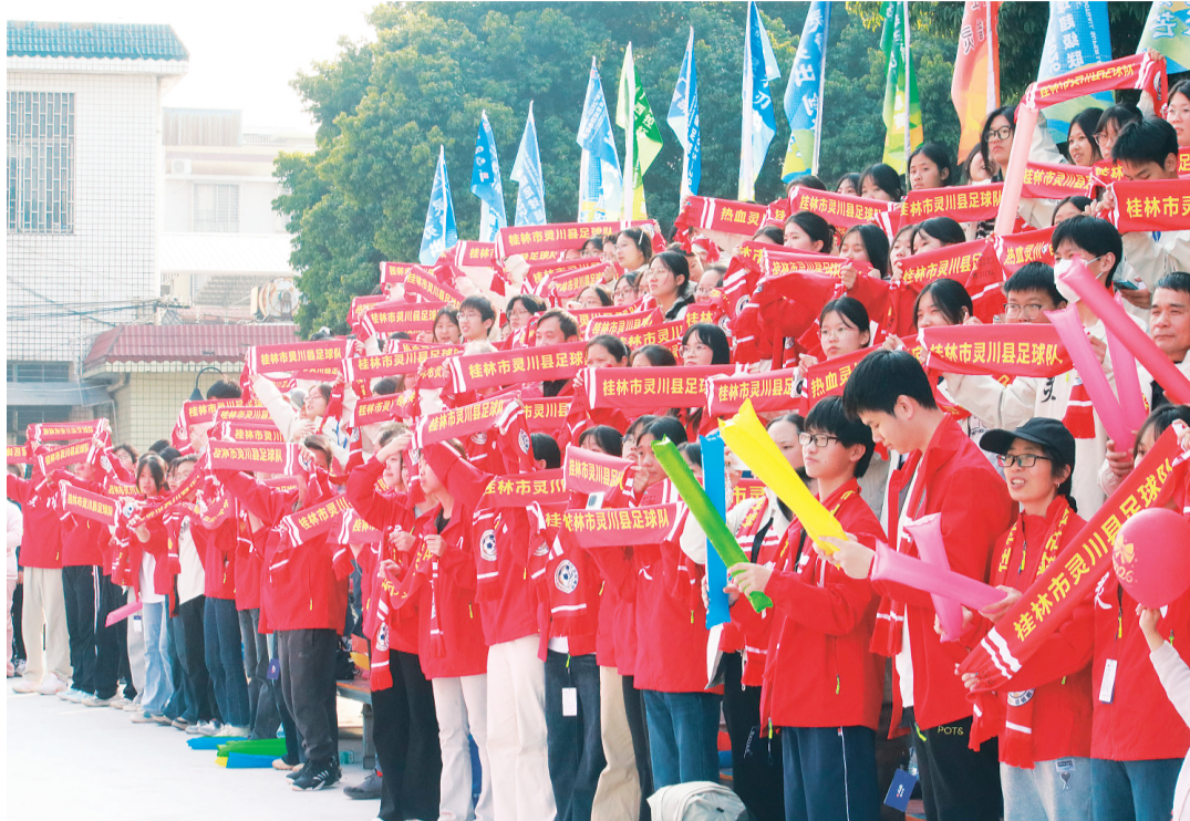
▲场外啦啦队花式助威。

比赛来到下半场后，为了保持场上的节奏，双方教练都果断进行换人调整。桂林市灵川县队通过换人，试图进一步增强进攻火力，打破场上僵局；来宾市武宣县队则通过换人，补充防守力量，稳固防线。然而，常规