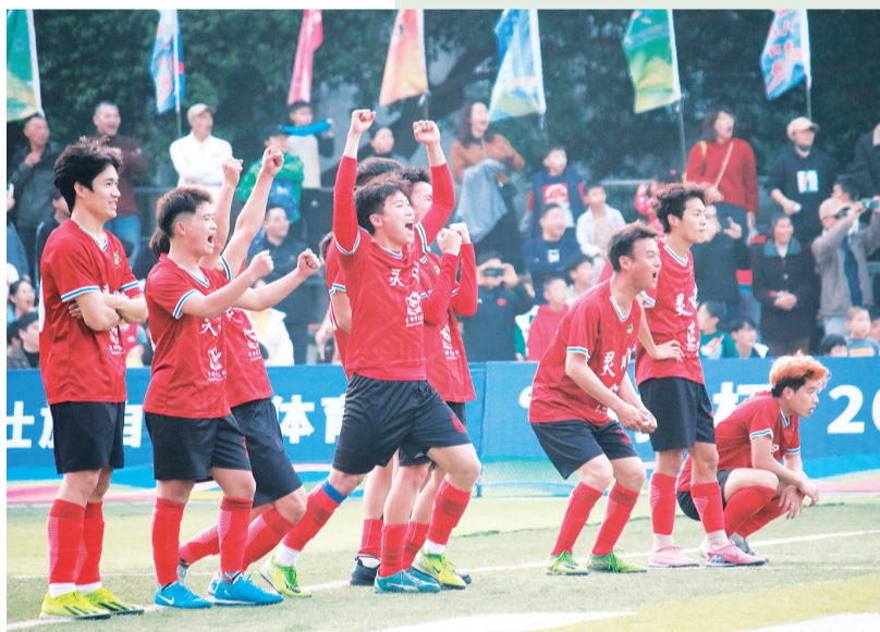
▲桂林市灵川县队点球罚中，球员们欢呼呐喊。