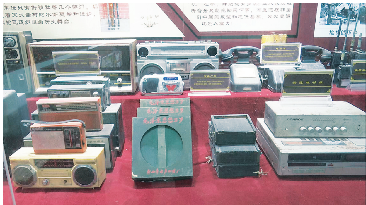
▲馆内收藏整理的老物件。