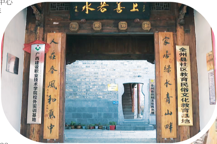
◀思源民俗博物馆大门。