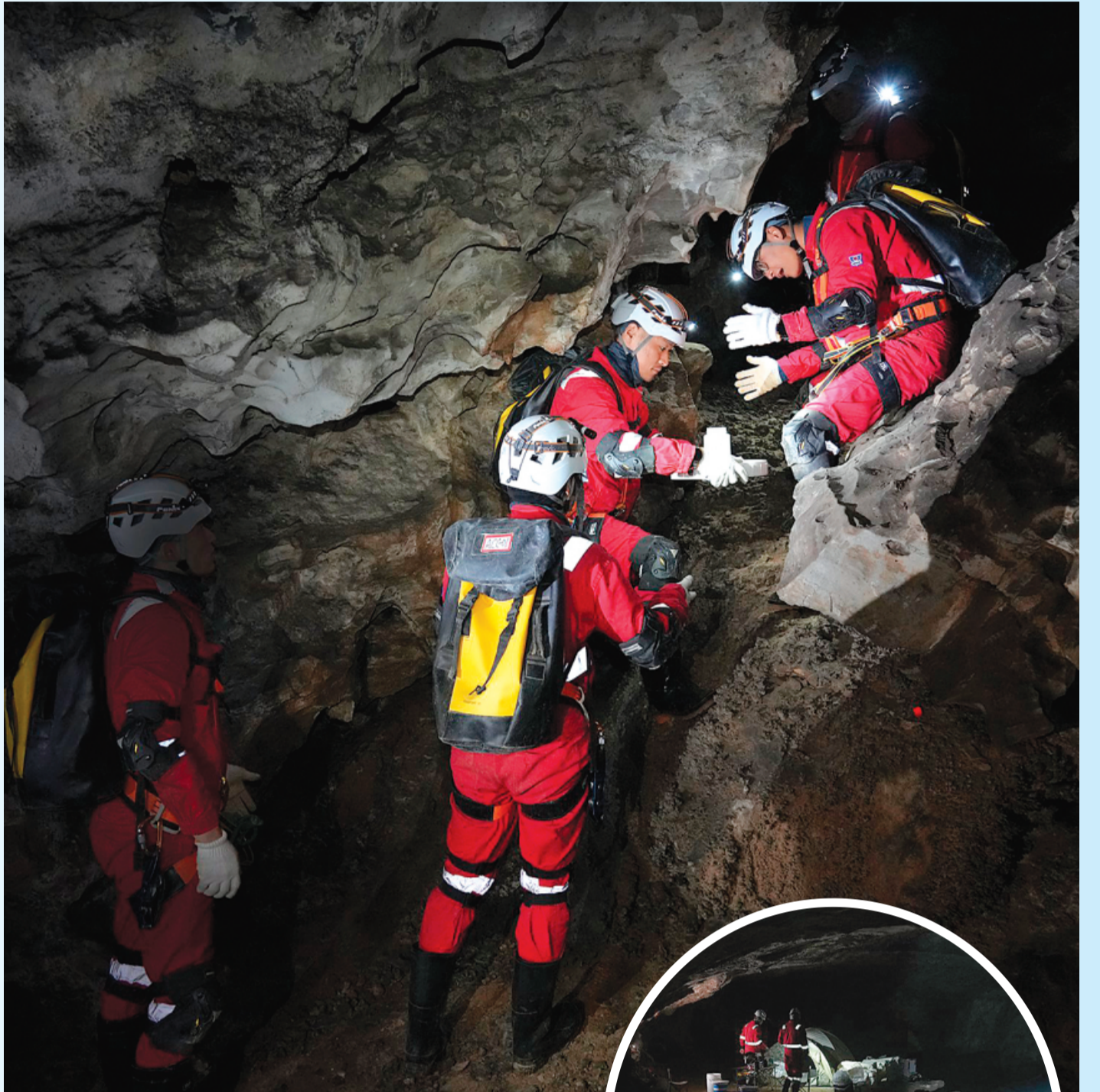
▲2025年12月,航天员在洞穴中进行物品传递协作训练。