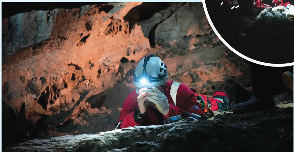
▲这是2025年12月拍摄的航天员开展洞穴训练的主营地。