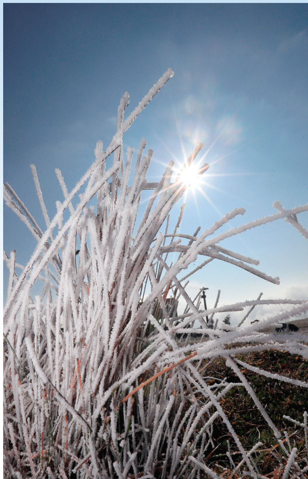
▲ 阳光照射下的雾凇。