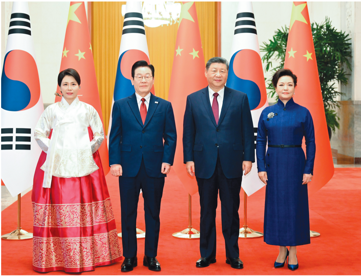
▲ 1 月 5 日下午，国家主席习近平在北京人民大会堂同来华进行国事访问的韩国总统李在明举行会谈。这是会谈前，习近平和夫人彭丽媛同李在明和夫人金惠景合影。

新华社北京 1 月 5 日电（记者冯喆、曹嘉琳）1 月 5 日下午，国家主席习近平在北京人民大会堂同来华进行国事访问的韩国总统李在明举行会谈。 习近平向韩国人民致以诚挚新年祝福。习近平指出，我和李在明总统已两次见面并实现互访，体现了双方对中韩关系的重视。作为朋友和邻居，中韩应该多走动、常来往、勤沟通。中方始终将中韩关系置于周边外交重要位置，对韩政策保持连续性、稳定性。中方愿同韩方一道，牢牢把握友好合作方向，秉持互利共赢宗旨，推动中韩战略合作伙伴关系沿着健康轨道迈进，切实增进两国人民福祉，为地区乃至世界和平与发展正向赋能。 习近平强调，中韩两国长期保持“和而不同”“和而不同”，超越社会制度和意识形态差异，相互成就、共同发展。双方应延续这一优良传统，不断增进互信，尊重各自选择的发展道路，照顾彼此核心利益和重大关切，坚持通过对话协商妥善解决分歧。中共二十届四中全会审议通过“十五五”规划建议，为未来 5 年中国发展擘画蓝图，也为世界各国提供广阔机遇。中韩经济联系紧密，产业链供应链深度融合，合