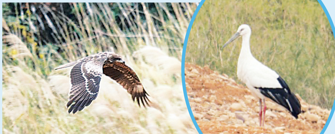
▲国家二级保护野生动物黑鸛。