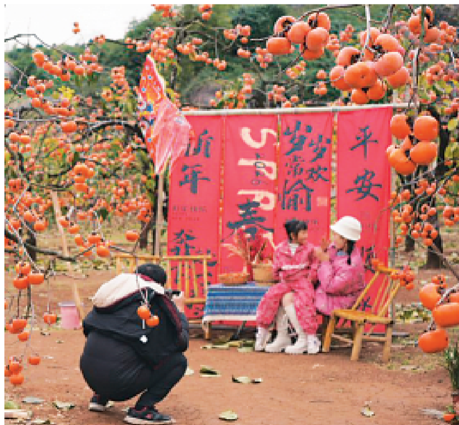
▲柿和园里人们在拍照。