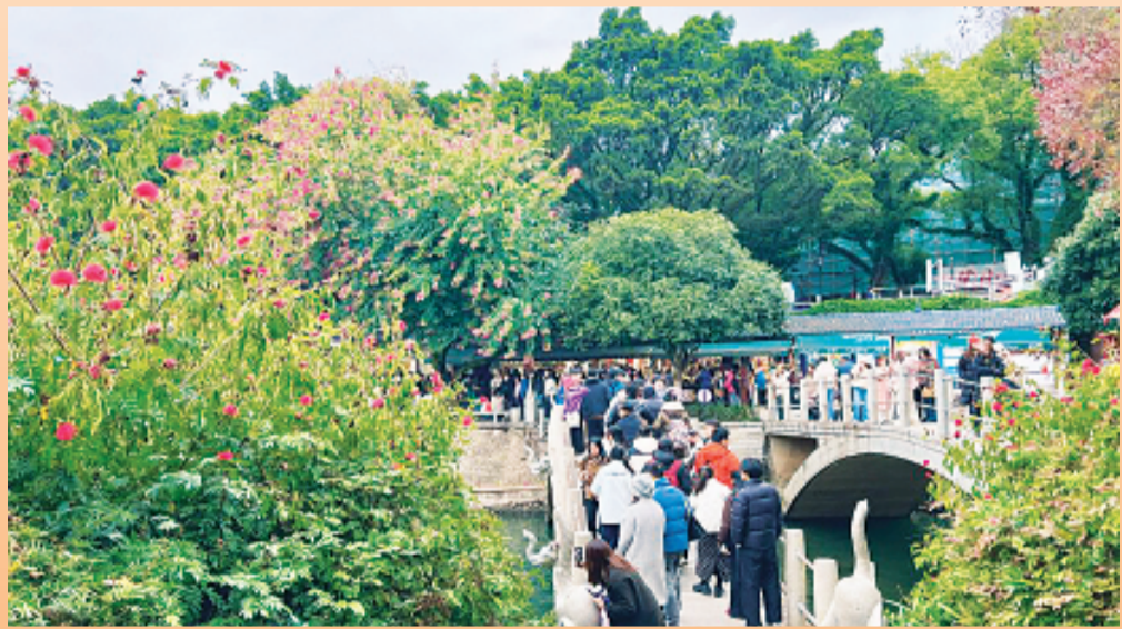
▲公园景区内，花叶迎客来。