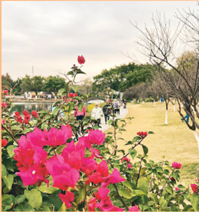
▲穿山公园内三角梅绽放，亮眼迎客。