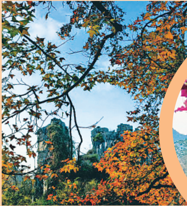
▲彩叶映衬下的骆驼山。