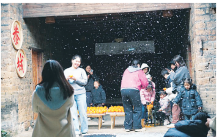
▶人工雪景让“村咖”的游客们非常惊喜。