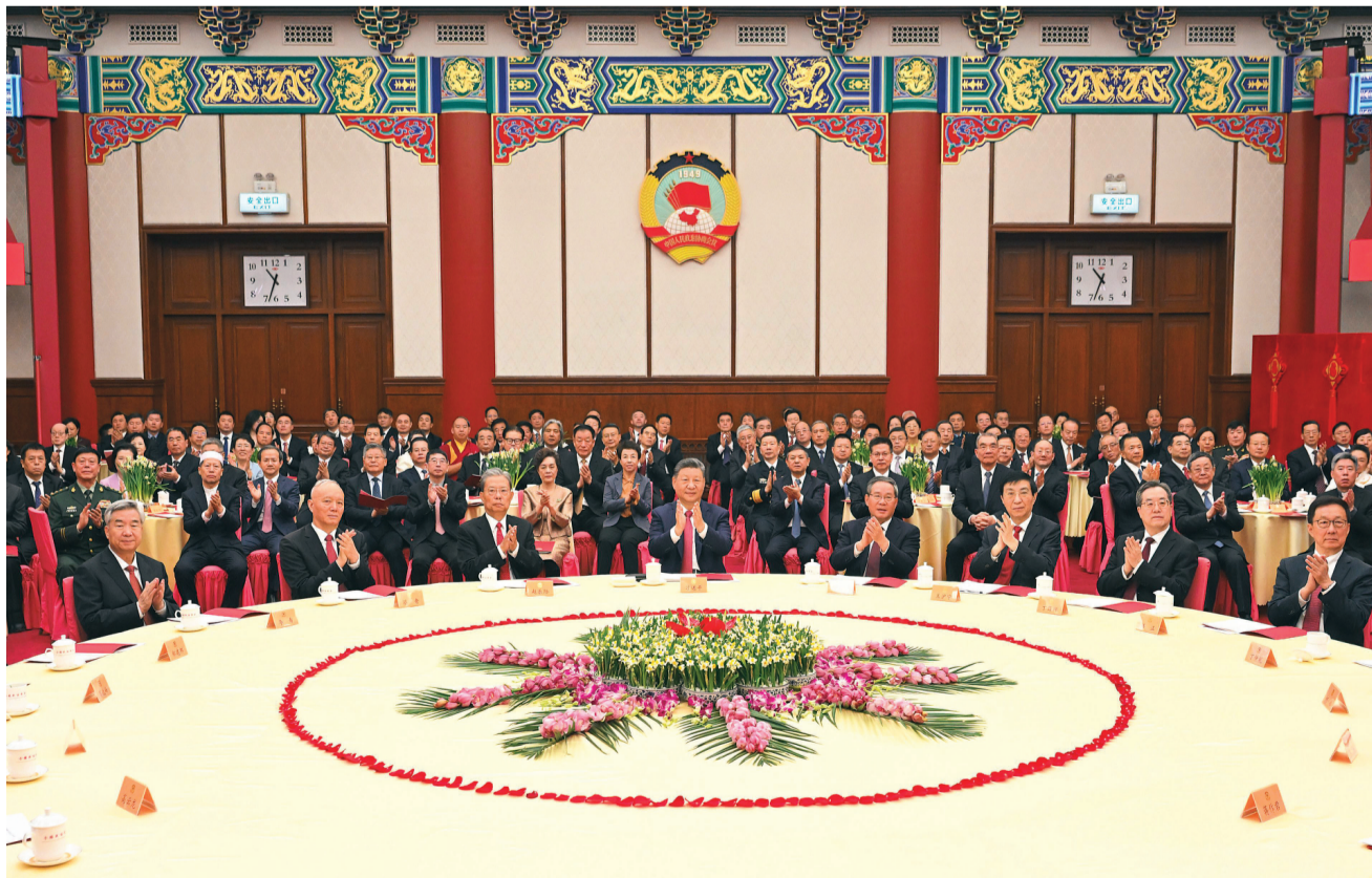
▲12月31日,全国政协在北京举行新年茶话会。党和国家领导人习近平、李强、赵乐际、王沪宁、蔡奇、丁薛祥、李希、韩正出席茶话会并观看演出。

习近平指出,2025年是很不平凡的一年。我们迎难而上、奋力拼搏,顺利完成经济社会发展主要目标,办了不少大事要事。我国经济顶压前行、向善向好发展,展现强大韧性和活力,改革开放迈出新步伐,民生保障更加有力,社会大局保持稳定。(下转第二版)