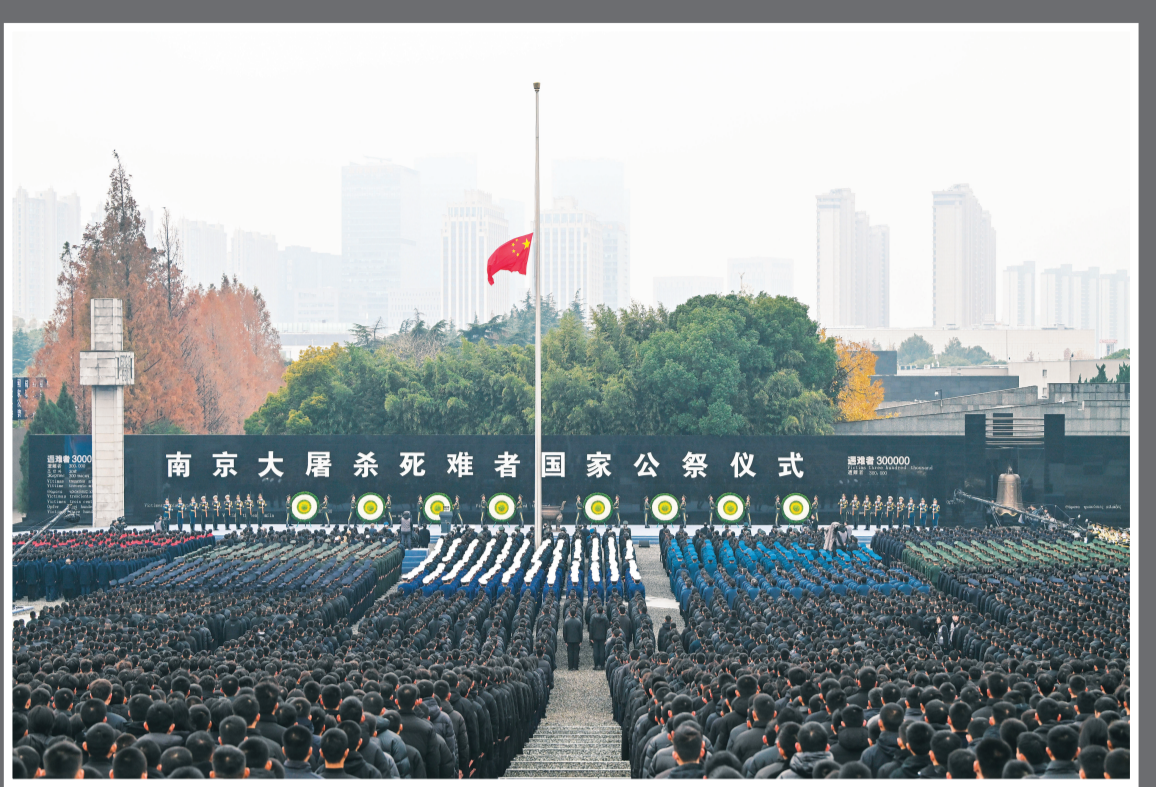
△这是12月13日拍摄的南京大屠杀死难者国家公祭仪式现场。

2014年2月27日，十二届全国人大常委会第七次会议通过决定，以立法形式将12月13日设立为南京大屠杀死难者国家公祭日。