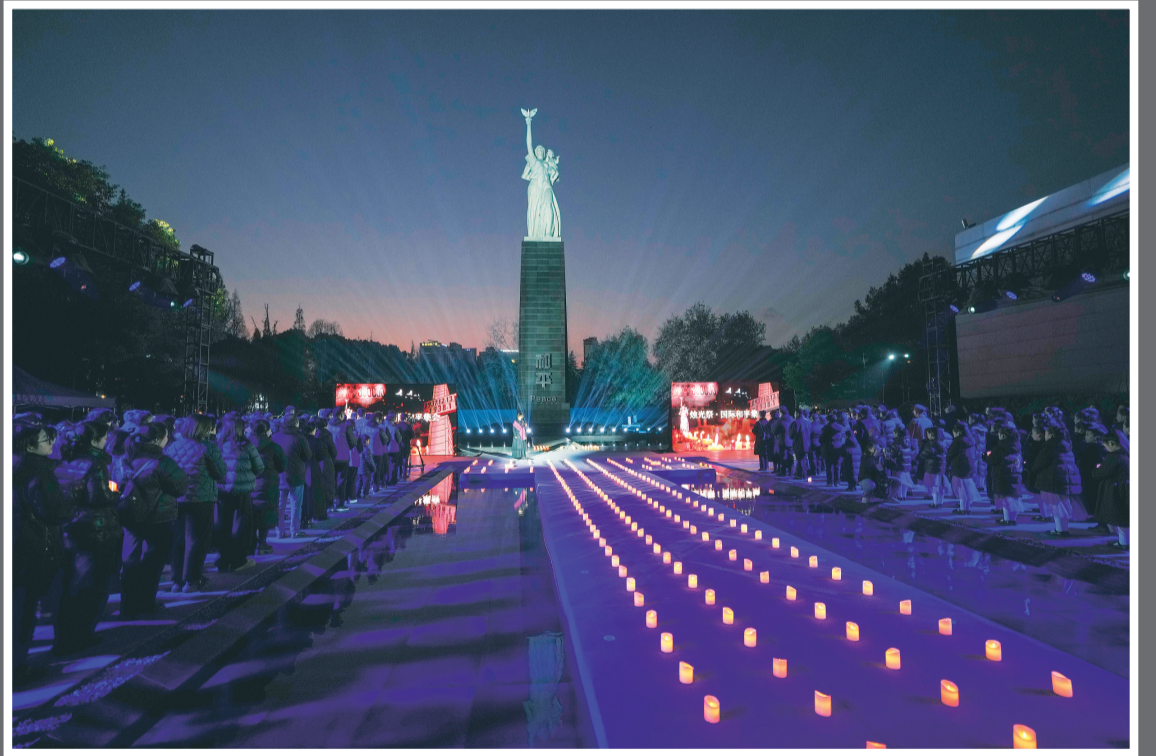
△12月13日，人们在侵华日军南京大屠杀遇难同胞纪念馆参加“烛光祭”活动。