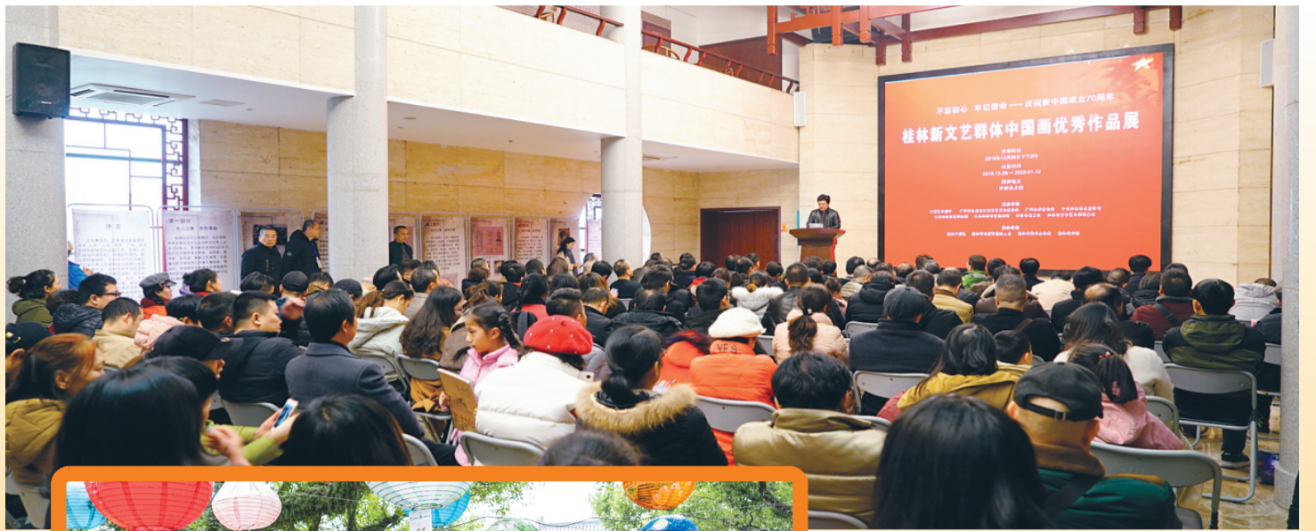
▲ 新文艺群体画展开幕。

紧扣“做人的工作”核心任务，着力建设高素质文艺人才队伍，汇聚领军人才，培养本土名家，努力把各类优秀人才聚集到党和人民的文艺事业中来。据统计，第四次文代会以来，我市新发展市、自治区级文艺家协会会员905人、自治区级文艺家协会会员345人、全国文艺家协会会员197人，文艺人才队伍持续壮大，门类更齐全，结构更合理。