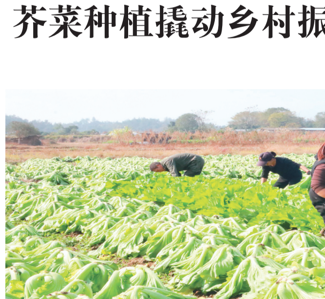
▲ 村民在采收芥菜。

稳定的订单也让周边村民直接受益。“我是隔壁村的，像我们年纪大了，不能再外出打工，在这里收芥菜，不算什