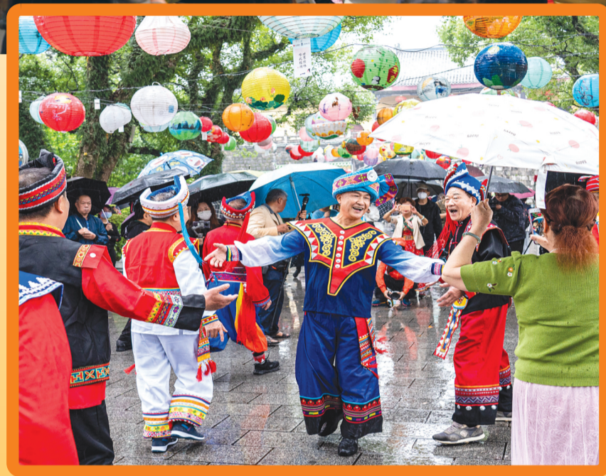
▲ 2022年“滴水清音”文艺志愿服务活动场景。