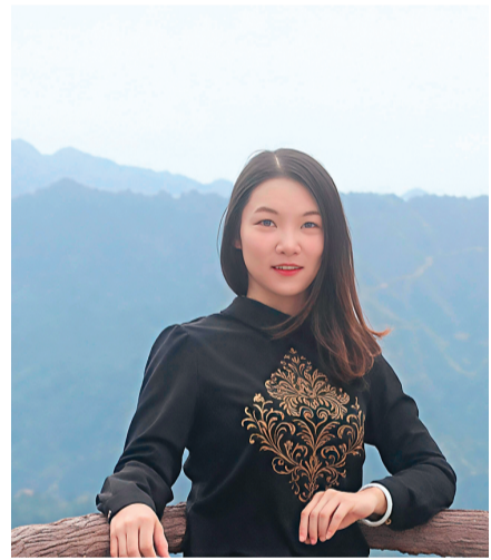
拓国际市场提供实操指导,提振了企业信心。2025年三季度,辖区多项工业指标增长显著,彰显出蓬勃的创新活力。

针对企业国际化发展需求,她还联动管委会举办“外贸进出口企业业务培训会”,邀请海关业务骨干授课,为企业开