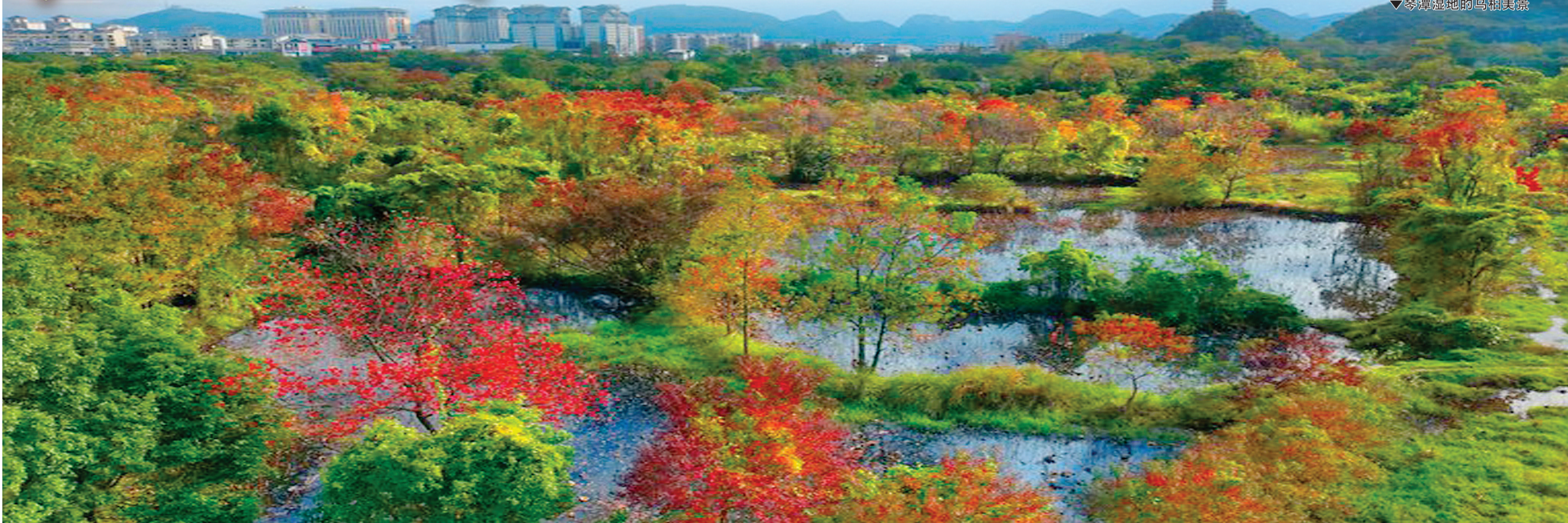
▼琴潭湿地的乌柏美景