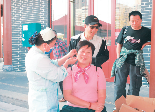
▲游客体验传统中医。