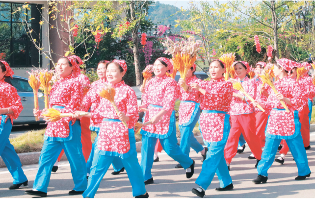
▲来自全国各地的老人参与千人健步走活动。