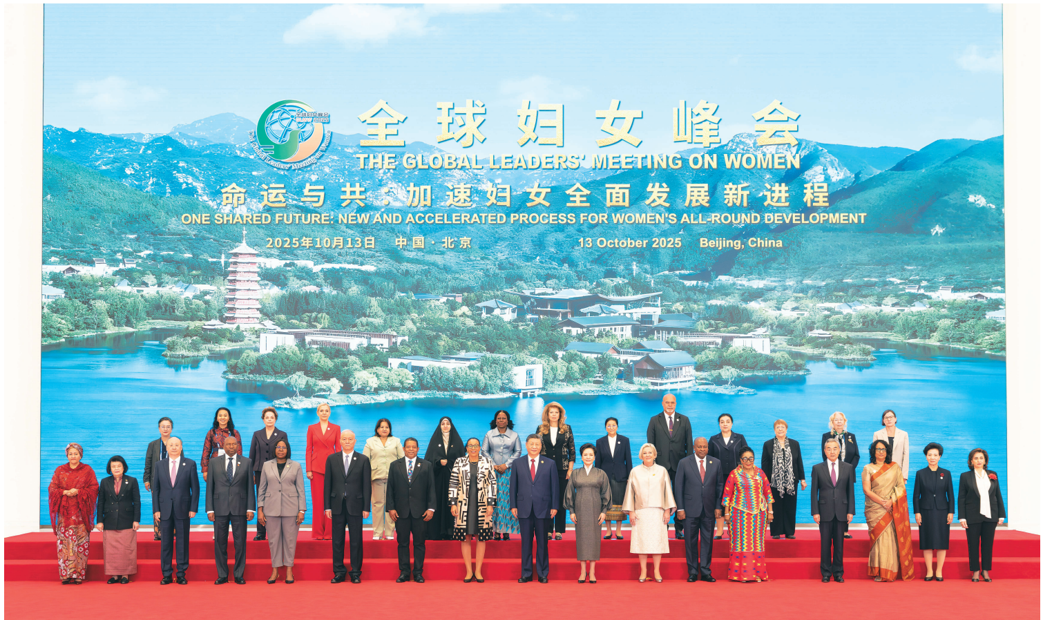
▲ 10 月 13 日上午,国家主席习近平在北京国家会议中心出席全球妇女峰会开幕式并发表主旨讲话。这是习近平和夫人彭丽媛同与会各国和国际组织代表团团长夫妇合影留念。