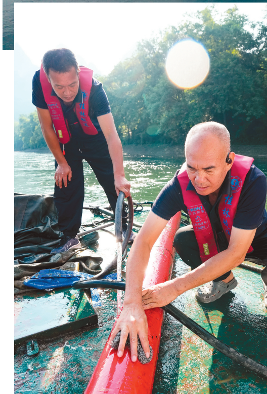
▲桂林航道站投放新的航标后驶向另一个目的地。