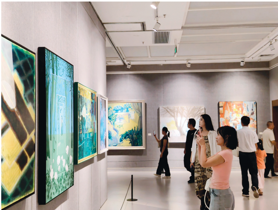
▲9月13日，“游·漓”——广西油画双年展在桂林美术馆开幕。展览吸引了众多观众前来观看。

市委宣传部常务副部长、桂林市融媒体中心党委书记、主任诸葛亚在发言中表示，从汉代张衡“我所思兮在桂林”，到韩愈“江作青罗带，山如碧玉簪”，再到抗战时期徐悲鸿创作《漓江春雨》《兴坪春雨》推动广西油画发展，桂林始终是艺术家的灵感