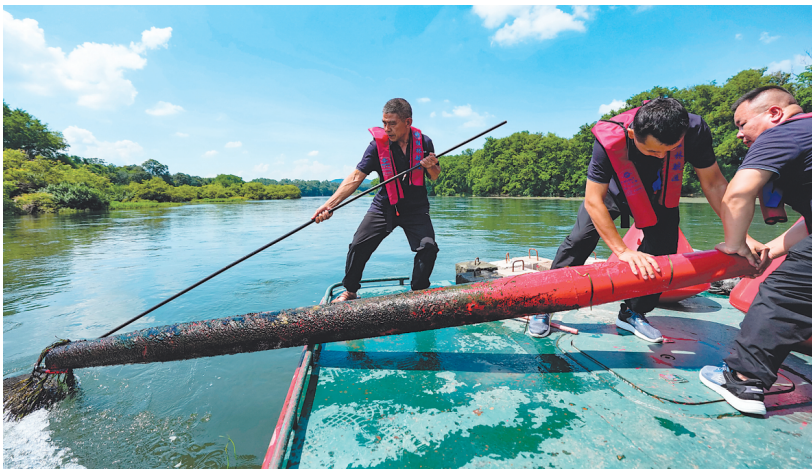
▲航标员相互配合奋力将杆形航标和沉块拉上航标船。