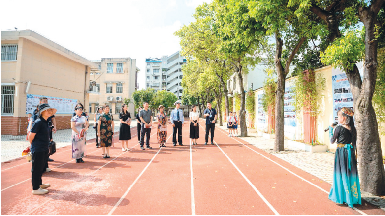
▲在校园红领巾讲解员引领下,与会领导嘉宾参观校史墙。

蒙然强调,学校已经走过四十年,历经建设初期的艰苦奋斗到创新时期的探索攀登。教师德才兼备学生积极向上,一代代各族师生以忠诚担