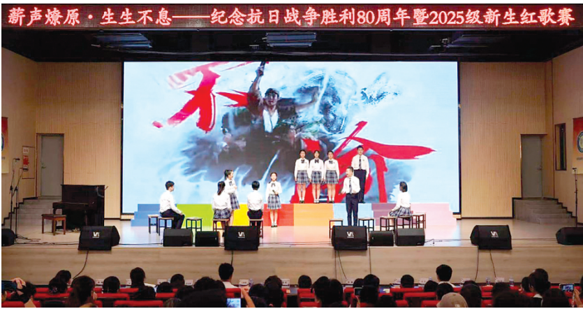
▲新生红歌赛活动现场

生长第一课,红歌燃初心。学校以中国人民抗日战争暨世界反法西斯战争胜利80周年纪念日为契机,举办“薪声燎原·生生不息”新生红歌赛唱响校园,所