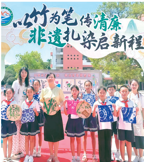
▲同学们通过非遗扎染体验、清廉文化展示等特色活动,开启新学期第一课。

桂林市西南中心校将持续探索“非遗+德育”特色育人模式,通过文化体验活动,让清廉种子在孩子们心中生根发芽。本次活动不仅帮助新生快速适应校园生活,更以润物无声的方式传承传统文化,培育时代新人。(记者吴林峰 通讯员卢贞凌)