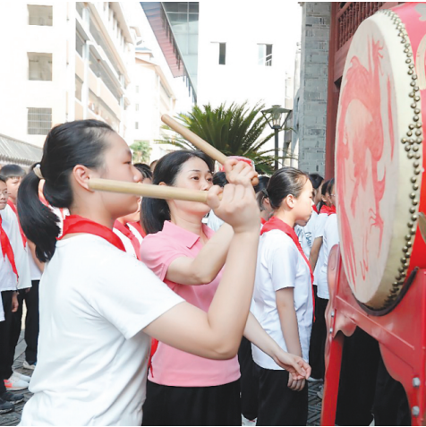
▲班主任带领学生在奎光楼前叩响“求知门”,击鼓鸣志,启智明心。

从开学典礼到入学礼,以“厚情怀”串联历史与当下,以“启新程”凝聚师生力量。整场活动融历史底蕴与育人使命于一体,传递出桂中在传承中创新、在奋进中启航的坚定信念。(李潜 黄芷璇)