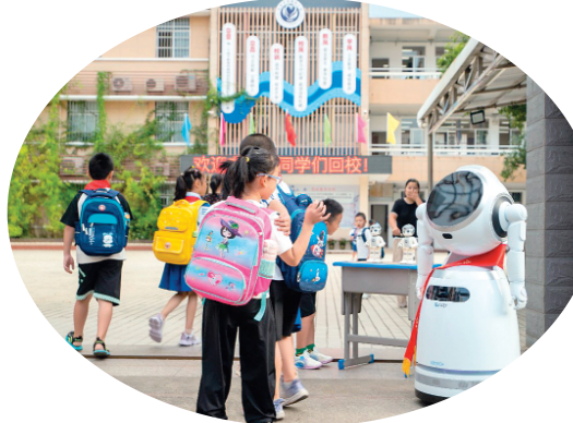
▲新学期、新气象,科技机器人迎接师生返校。蒋林珠 摄