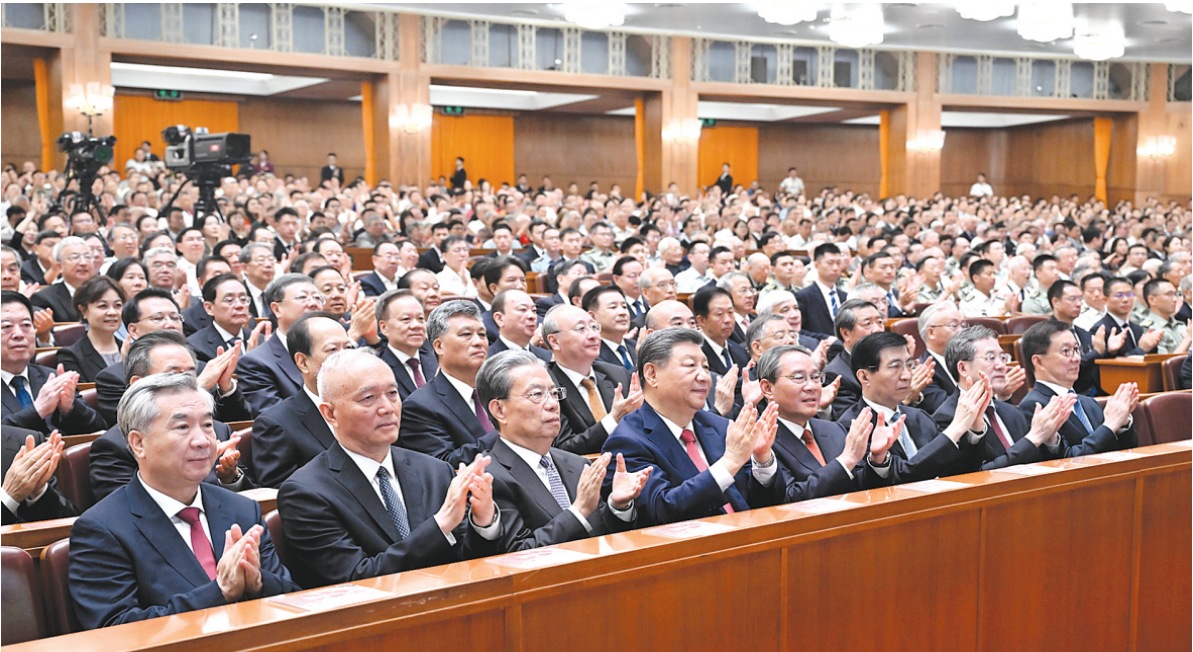
▲9月3日，纪念中国人民抗日战争暨世界反法西斯战争胜利80周年文艺晚会《正义必胜》在北京人民大会堂隆重举行。习近平、李强、赵乐际、王沪宁、蔡奇、丁薛祥、李希、韩正等党和国家领导人，与约6000名中外人士一起观看晚会。

新华社北京9月3日电 歌声嘹亮，唱响胜利华章；舞姿雄壮，展现正义力量。纪念中国人民抗日战争暨世界反法西斯战争胜利80周年文艺晚会《正义必胜》3日晚在北京人民大会堂隆重举行。习近平、李强、赵乐际、王沪宁、蔡奇、丁薛祥、李希、韩正等党和国家领导人，与约6000名中外人士一起观看晚会，共同纪念这个光辉的日子。