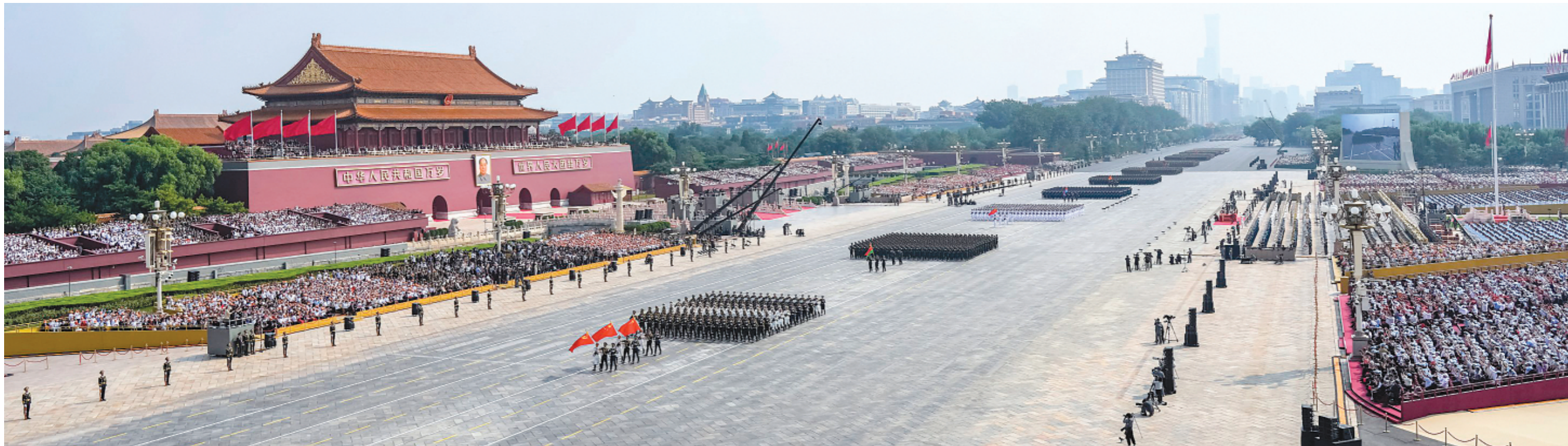
▲ 9 月 3 日，纪念中国人民抗日战争暨世界反法西斯战争胜利 80 周年大会在北京隆重举行。这是徒步方队接受检阅。