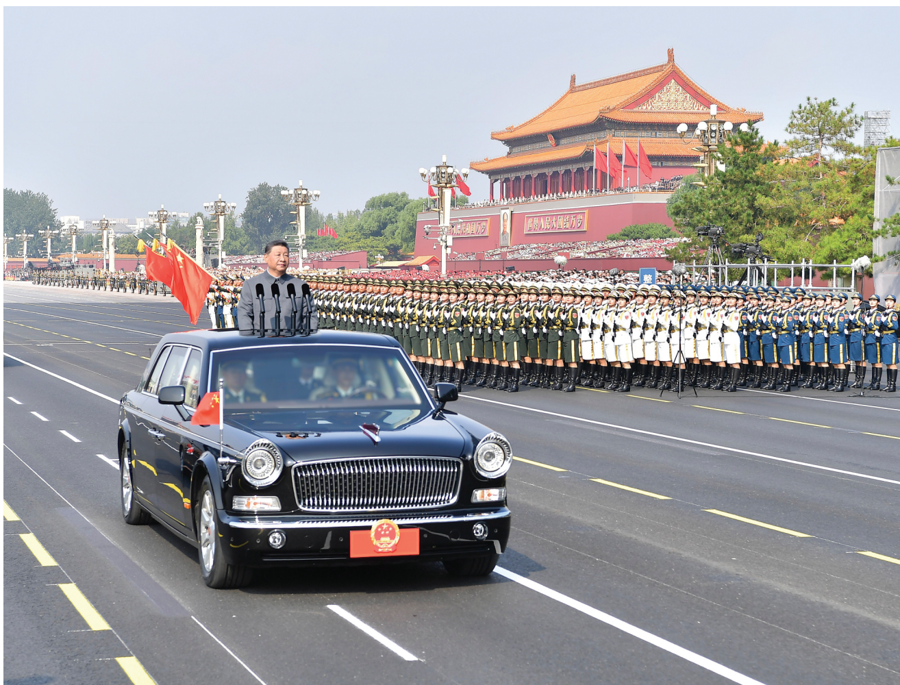
▲ 9 月 3 日，纪念中国人民抗日战争暨世界反法西斯战争胜利 80 周年大会在北京天安门广场隆重举行。这是中共中央总书记、国家主席、中央军委主席习近平检阅受阅部队。

新华社北京 9 月 3 日电 铭记伟大历史胜利，凝聚正义和平力量。9 月 3 日上午，纪念中国人民抗日战争暨世界反法西斯战争胜利 80 周年大会在北京天安门广场隆重举行，以盛大阅兵仪式，同世界人民一道纪念这个伟大的日子，共同开创更加光明的未来。中共中央总书记、国家主席、中央军委主席习近平发表重要讲话并检阅受阅部队。